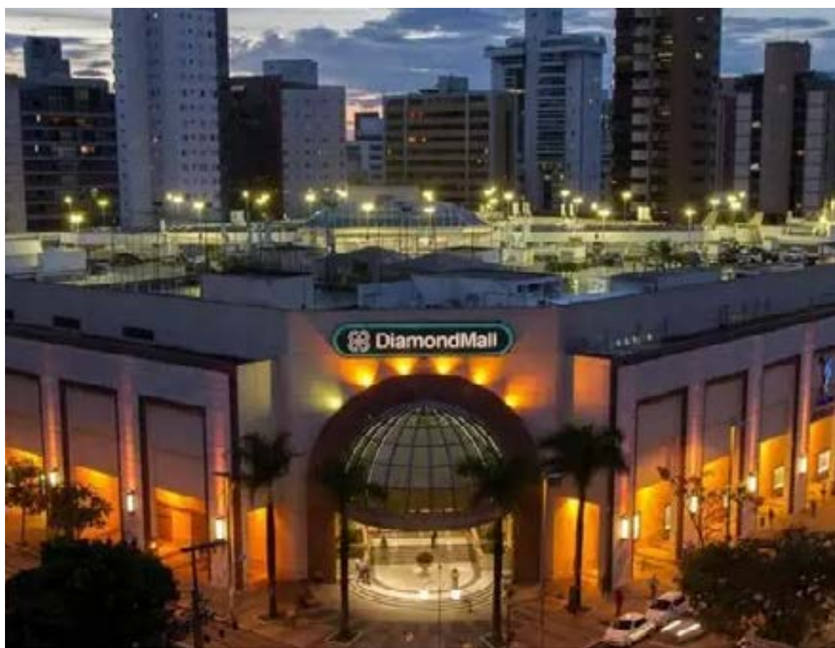
Atlético vendeu 49,9% do Diamond Mall por R$ 340 milhões

No estudo, o Atlético também deixou claro que o dinheiro da venda do shopping é para solucionar problemas financeiros. Desta forma, não serão feitos investimentos no futebol. O valor também não será utilizado para quitar parte da dívida com mecenas que ajudaram o clube a montar o time campeão no último ano. ( Supersportes )