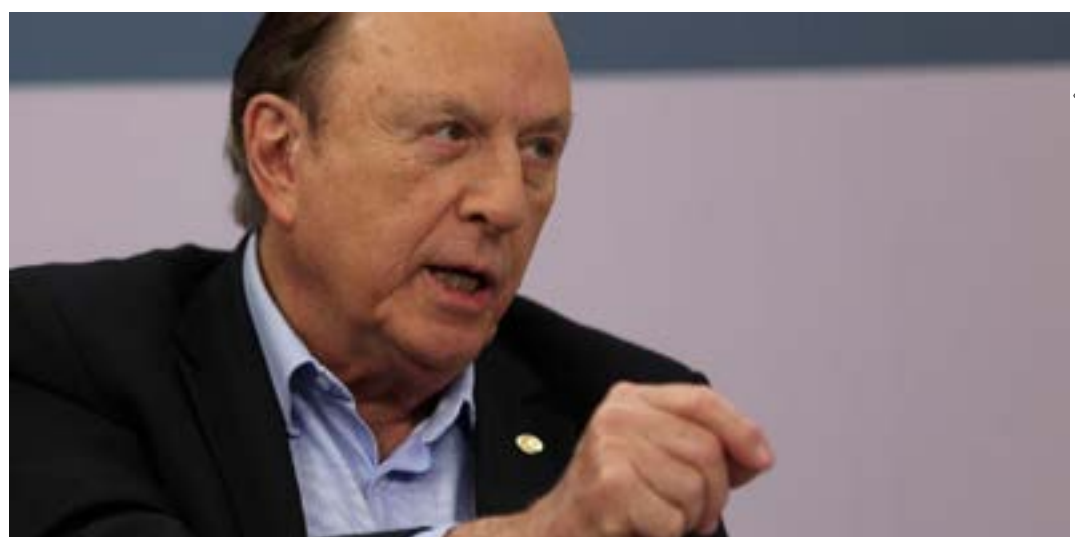
É a sexta vez que o candidato concorre à Presidência

Como líder universitário, Eymael presidiu o Centro Acadêmico São Tomás de Aquino da Faculdade de Filosofia da PUC-RS e a Federação dos Estudantes de Universidades Particulares do Rio Grande do Sul (FEUP). Nessas funções, coordenou campanhas nacionais e regionais como a do Barateamento do Livro Didático. Em 1962, ingressou no Partido Democrata Cristão (PDC) em Porto Alegre, passando a atuar na Juventude Democrata Cristã. Eymael foi deputado constituinte.