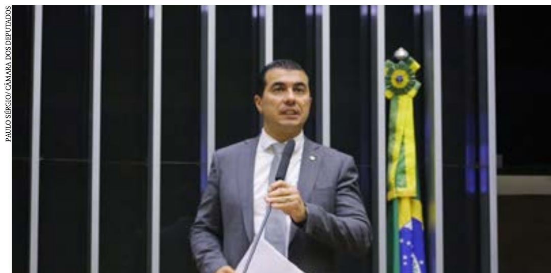
O autor da proposta, deputado Luis Miranda

O Projeto de Lei 1444/22 obriga a Receita Federal a informar todos os anos aos contribuintes pessoa física as incompatibilidades existentes entre a sua declaração de Imposto de Renda (IR) e as fornecidas pelos empregadores na Declaração do Imposto sobre a Renda Retido na Fonte (Dirf).