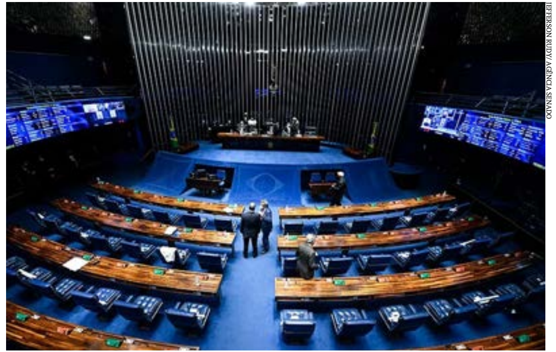
Também estão em pauta a MP que trata de relações trabalhistas alternativas e a que destina recursos para programa de renovação de frota de ônibus e caminhões

Na votação da medida provisória, os deputados incluíram mudanças no Código de Trânsito Brasileiro sobre habilitação, descanso em rodovias e veículos abandonados. A MP perde o vigor na próxima quinta-feira (11).