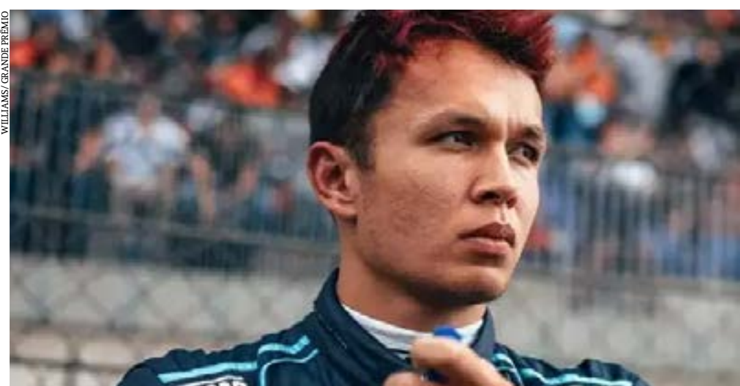
Alex Albon renova com a Williams até 2023