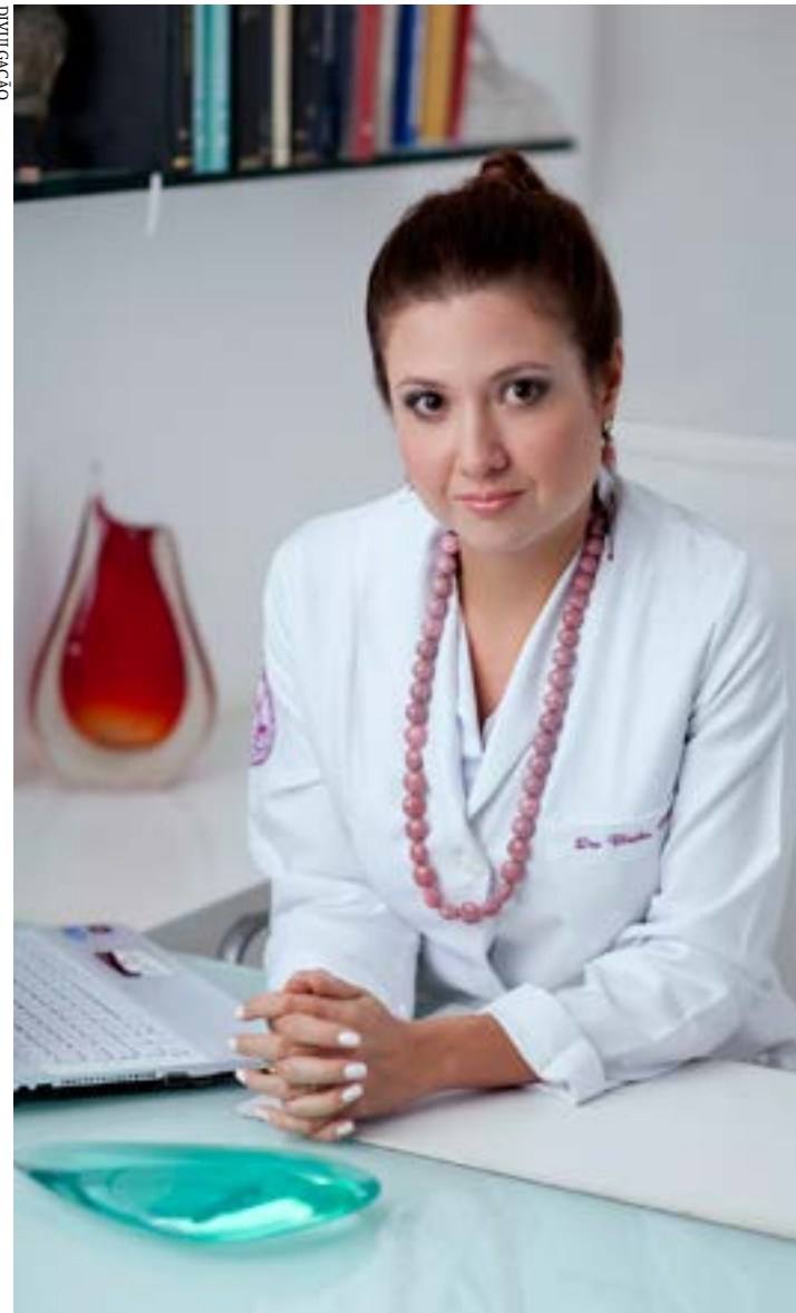
Especialista alerta para o cuidado com a alimentação