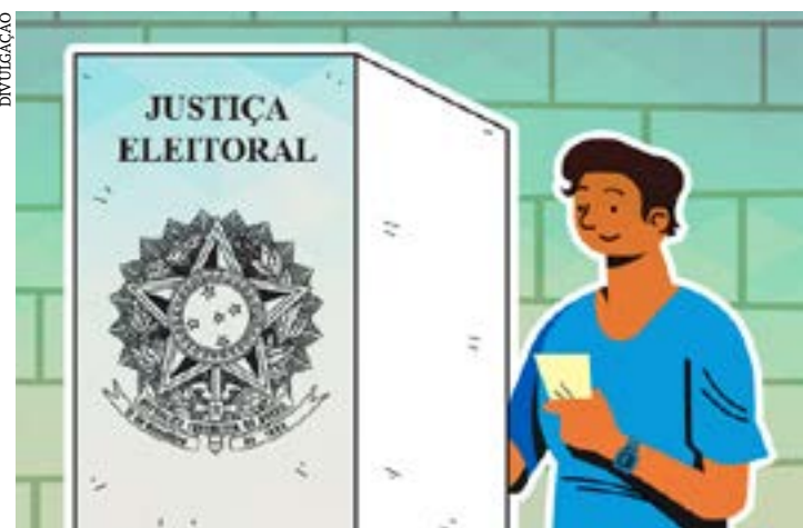
Em agosto começam a contar os prazos para definir o quadro das eleições deste ano

19 de dezembro - último dia para a diplomação dos eleitos. (Agência Câmara)