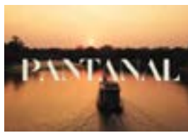
tapera de Juma.

José Lucas fala para Juma que só sai da tapera se ela quiser. Guta e Marcelo sentem que estão sendo castigados por não poderem viver seu amor. Guta não gosta de ver Zuleica e os filhos tomarem conta da fazenda. Juma se incomoda quando José Lucas diz que ama. Guta demonstra hostilidade no trato com Zuleica. Irma conta à mãe que está grávida. Maria Bruaca se nega a parar com a chalana ao avistar Tenório e Zuleica na beira do rio. Jove incentiva José Leôncio a derrubar a