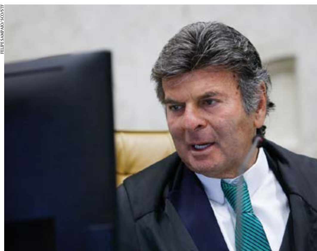
Declaração de Luiz Fux foi feita durante abertura do segundo semestre

ensível e aberta a todos aqueles que desejam contribuir positivamente para a lisura do prélio eleitoral", concluiu. (Agência Brasil)