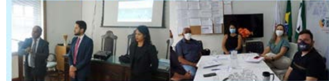
ESTRUTURAÇÃO DO SERVIÇO DE INSPEÇÃO MUNICIPAL REGIONAL - SIM APRESENTAÇÃO DA PROPOSTA DO PROCON REGIONAL