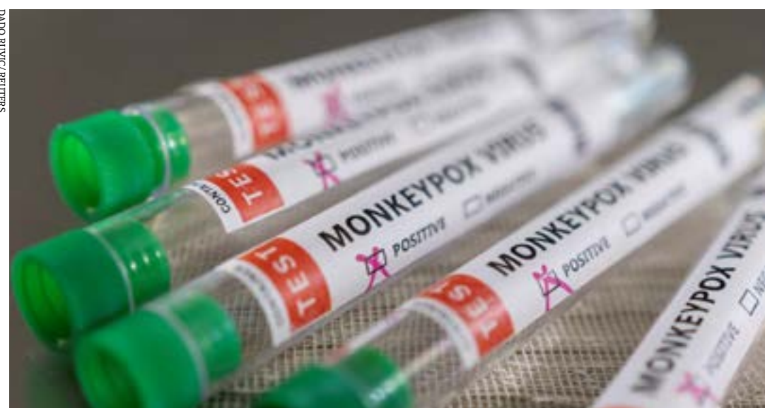
Inicialmente, serão contemplados os casos mais graves

roedores e primatas, mas também pode ser transmitida entre pessoas após contato direto ou indireto. (Agência Brasil)