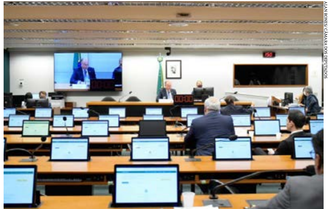
Reunião do Conselho de Ética e Decoro Parlamentar