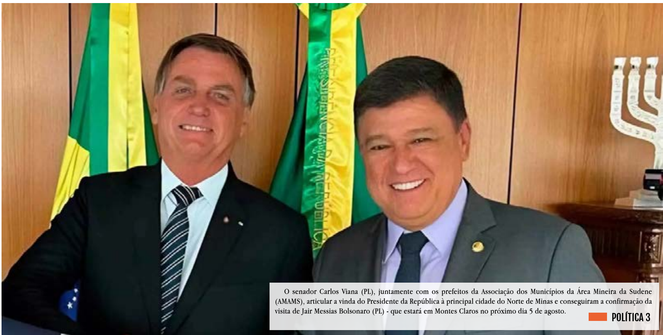
O senador Carlos Viana (PL), juntamente com os prefeitos da Associação dos Municípios da Área Mineira da Sudene (AMAMS), articular a vinda do Presidente da República à principal cidade do Norte de Minas e conseguiram a confirmação da visita de Jair Messias Bolsonaro (PL) - que estará em Montes Claros no próximo dia 5 de agosto.