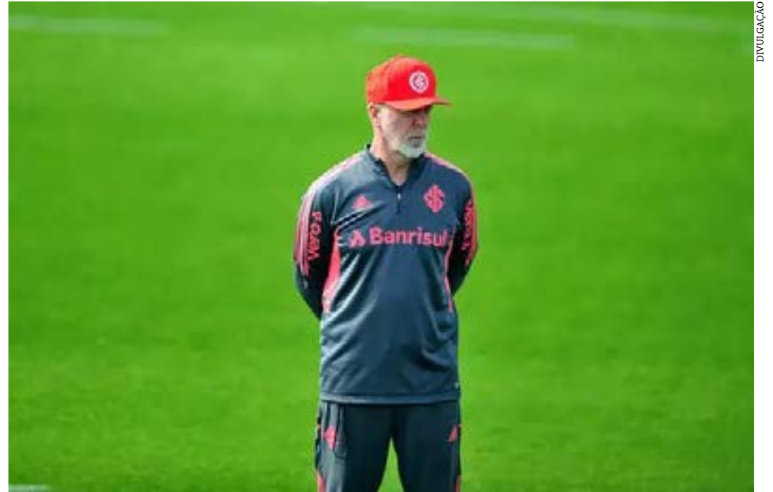
Mano Menezes está preparando o Inter para o confronto com o Atlético no domingo (31)

definiu um tropeço do time de Mano Menezes frente ao Palmeiras (2 a 1). Vale destacar que ambas as partidas foram fora de casa. ( Superesportes )