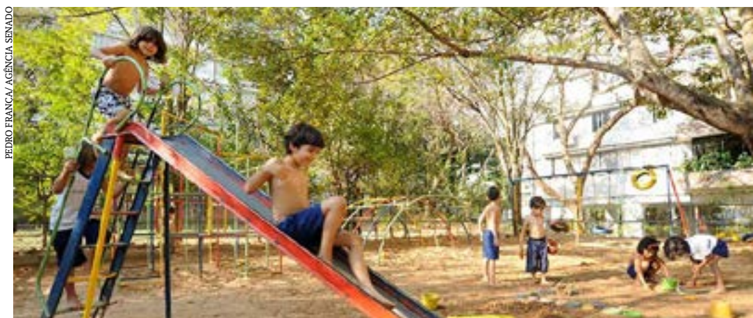
PL do senador Jorge Kajuru propõe que se obtenham mais informações sanitárias sobre crianças e adolescentes para melhorias no quadro brasileiro de saúde

Projeto de Lei (PL 1.881/2022) do senador Jorge Kajuru (Podemos-GO) altera o Estatuto da Criança e do Adolescente (ECA) para determinar a realização de pesquisas em saúde junto à população infantojuvenil para que se obtenham mais informações sanitárias, mantendo sigilo dos dados pessoais coletados, e propondo melhorias para o quadro brasileiro de saúde.