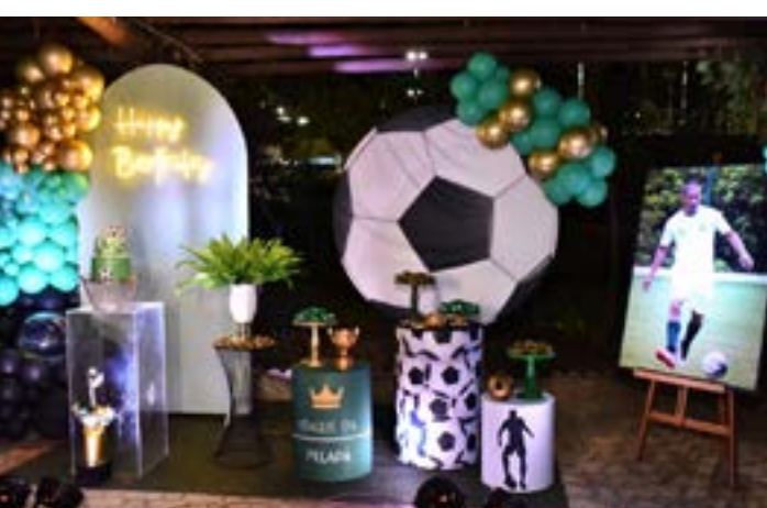
A decoração da noite foi um destaque à parte, destacando o futebol, uma das grandes paixões do aniversariante