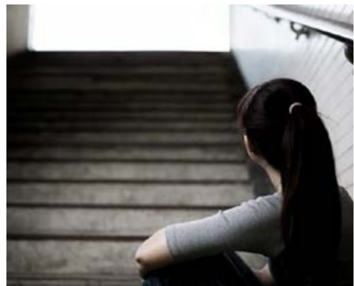
Semana da saúde mental busca superar preconceito sobre o assunto

TRAMITAÇÃO - O projeto tramita em caráter conclusivo e será analisado pelas comissões de Educação; e de Constituição e Justiça e de Cidadania. (Agência Câmara)