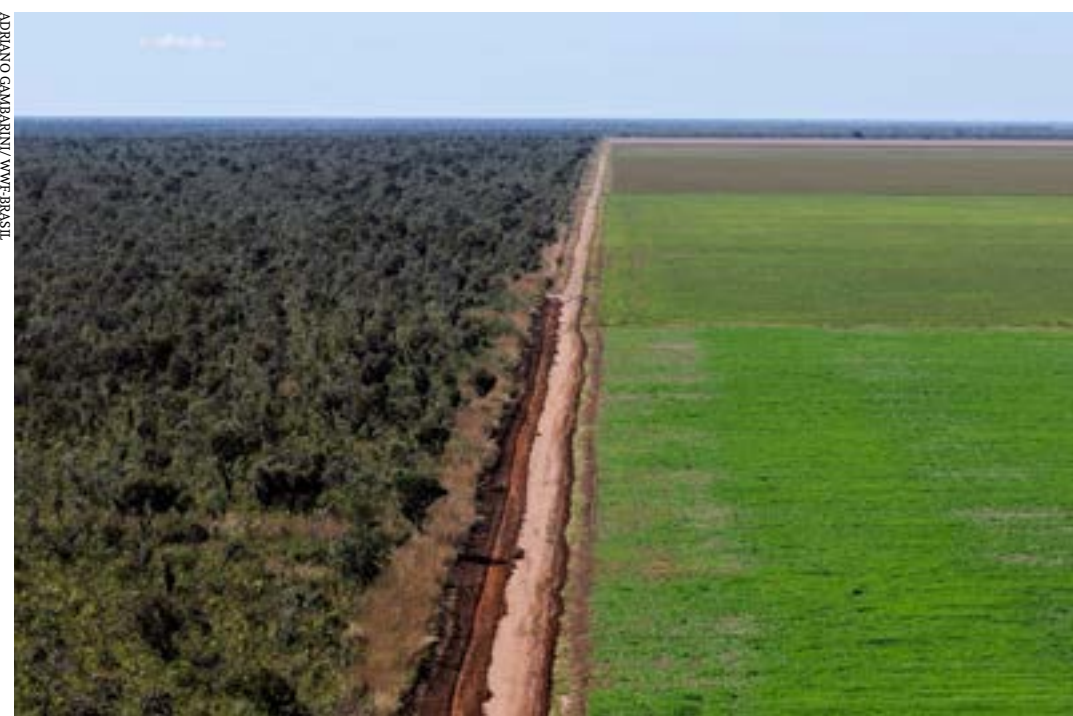
Um dos projetos polêmicos é o que revoga a Lei dos Agrotóxicos e muda regras de aprovação desses produtos

“O PL reflete uma necessidade de atualização normativa diante do desenvolvimento técnico e científico do mundo atual. (...) O Brasil é o único país representativo na produção de alimentos que utiliza o princípio da precaução para análise de produtos químicos de utilização agrícola. Para medicamentos e outros produtos já se utiliza análise de risco. Ou seja, os remédios que usamos já estão nessa nova forma, mas os pesticidas, não”, argumentou Gurgacz.