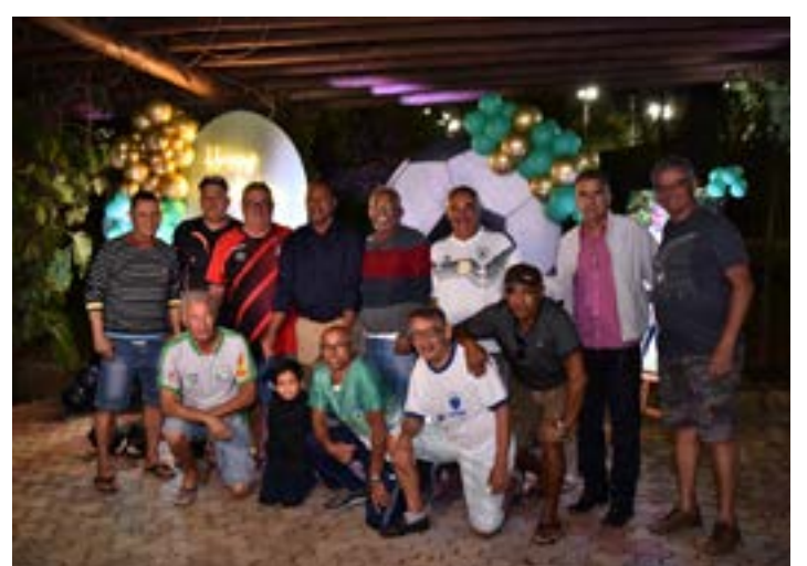
Mais uma da turma da pelada