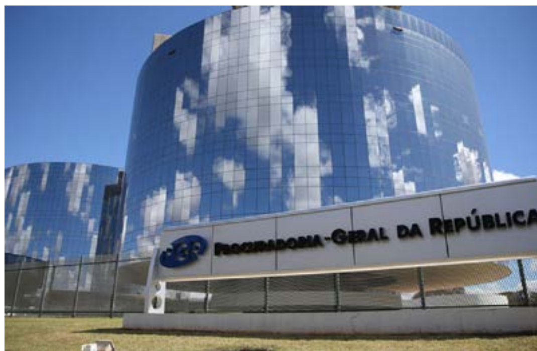
Procuradoria vê caráter político em CPI que motivou ações

Também nesta terça-feira, sete senadores protocolaram no STF ação que pede abertura de inquérito por prevaricação contra a vice-procuradora-geral da República, Lindórea Maria Araújo. O pedido é assinado pelos senadores que comandaram a CPI -- Omar Aziz (PSD-AM), Randolfé Rodrigues (Rede-AP) e Renan Calheiros (MDB-AL) -- e também por Humberto Costa (PT-PE), Tasso Jereissati (PSDB-CE), Fabiano Contarato (PT-ES) e Otto Alencar (PSD-BA). O texto aponta irregularidades na solicitação de arquivamento de sete das dez apurações sobre Jair Bolsonaro, ministros e ex-ministros com