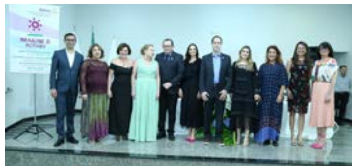
Conselho Diretor do Rotary Clube Tereza de Calcutá