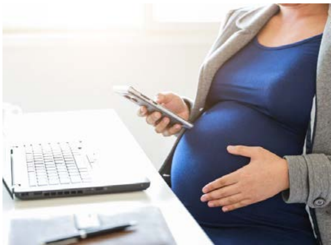
Lei estabelece que gestantes voltem ao trabalho presencial após imunização

O programa terá duração de 24 meses a partir da publicação da lei e será aplicável também ao Distrito Federal. (Agência Câmara)