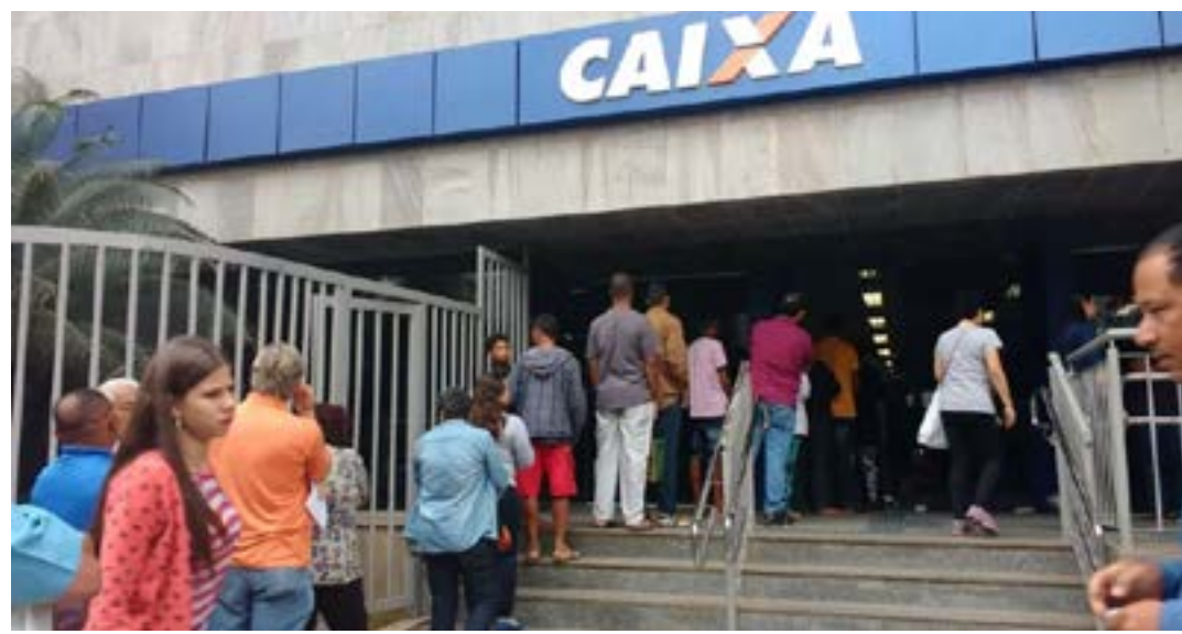
Medida foi aprovada por Conselho Curador do FGTS no início do mês

Para unidades entre R$ 350 mil e R$ 1,5 milhão (teto do Sistema Financeiro Habitacional), a taxa caiu de TR mais 8,66% ao ano para TR mais 8,16% ao ano, com 0,5 ponto percentual de redução. A Caixa também ampliou, para 80% do valor de avaliação do imóvel, a cota de financiamento na linha Pró-Cotista. (Agência Brasil)