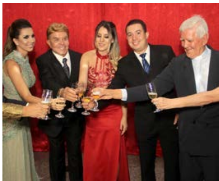
SEMPRE GOSTEI de comemorar a VIDA e o TRABALHO como estão vindo nesta foto num grande momento. Este ano, no dia 24 de setembro, no Vichi Maria, voltaremos a comemorar estas datas tão importante com o abadá '56 ANOS DE GLAMOUR'. É claro que espero contar com a presença de todos os casais e jovens que são verdadeiros amigos. Logo que chegar aí em MOC, na próxima semana, estarei reunindo com a equipe que me ajudará nos preparativos. Será uma noite diferente, mas mantendo o eterno Glamour.