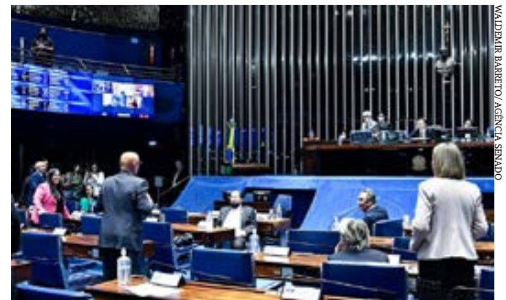
Entre as MPs analisadas, está a que completa a autorização para que produtores e importadores de etanol possam vender diretamente para postos de combustíveis, aprovada em 8 de junho

de contratos emitidas até 31 de dezembro de 2022, se decorrerem de medidas de isolamento social adotadas no combate à pandemia.