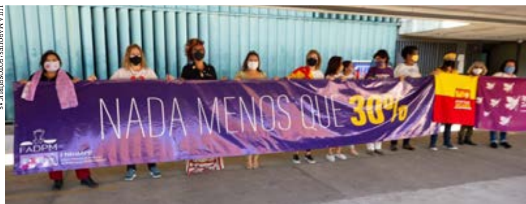
Texto também destina recursos para programas voltados à participação das mulheres na política

Texto obriga partidos políticos a destinar no mínimo 30% dos recursos públicos para campanha eleitoral às candidaturas femininas