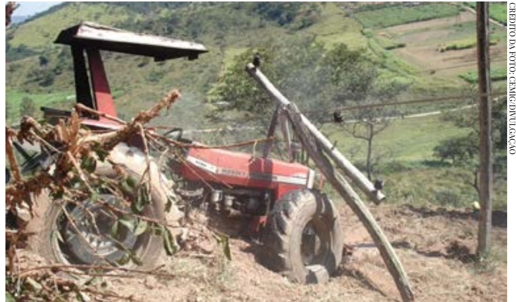
Durante manobras, máquinas agrícolas podem atingir os cabos de sustentação dos postes e provocar acidentes graves e até fatais.

contato com a rede, os ocupantes devem permanecer dentro da cabine até a chegada das equipes técnicas ou do Corpo de Bombeiros. Apenas em situação de incêndio, a saída deve ser feita com os pés juntos, sem tocar ao mesmo tempo no veículo e no solo, para evitar choque elétrico.