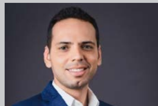
(*) Major PM – Chefe da Agência Regional de Comunicação Organizacional – 14ª RPM.