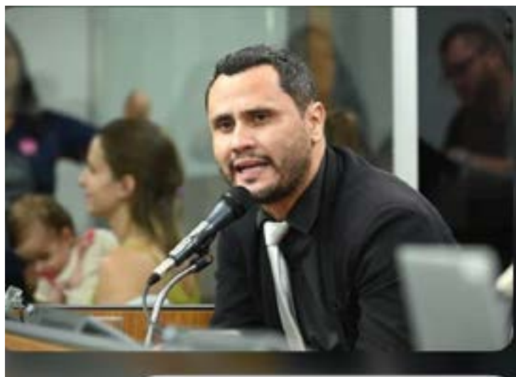
O PL decidiu intensificar as negociações com o senador Cleitinho Azevedo (foto) para construir uma aliança nas eleições ao governo de Minas em 2026. Entre os cenários discutidos estão uma chapa encabeçada por Cleitinho, com indicação do vice pelo partido, ou uma candidatura própria do PL com apoio do senador. A sigla também descartou apoiar o governador Mateus Simões devido ao alinhamento nacional com o grupo de Romeu Zema.