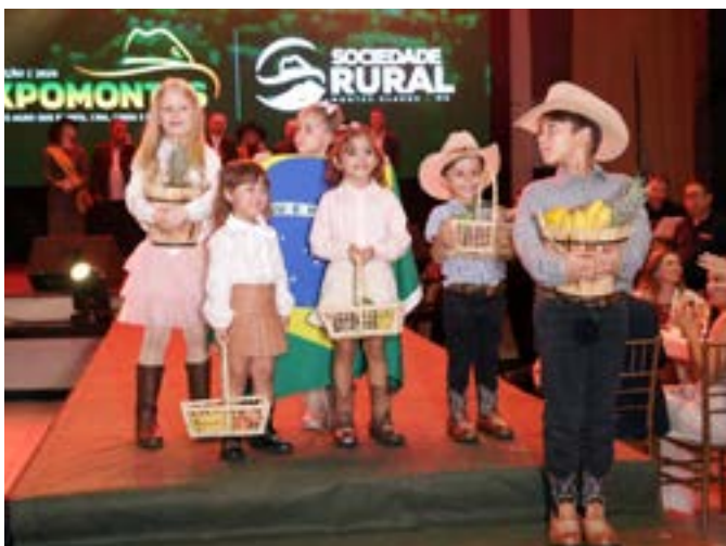
VEJAM que belo grupo de crianças que representaram o nosso rico agro.