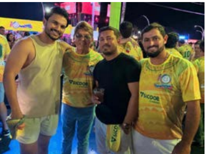
COM amigos que vieram de Guanambi.