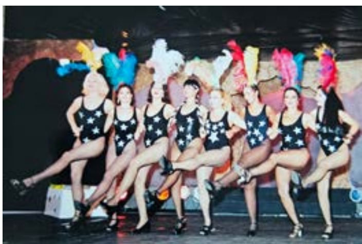
As charettes da Buzina do Chacrinha encenada no espetáculo BRASA MORA(1996) que reviveu os anos dourados da nossa juventude

Mais do que um espetáculo, o Showçaite reafirma seu papel como um elo entre cultura e responsabilidade social. Em tempos em que iniciativas solidárias se tornam cada vez mais necessárias, o evento ressurgiu como um convite à participação coletiva, celebrando a vida e reforçando a importância de contribuir para o bem comum.