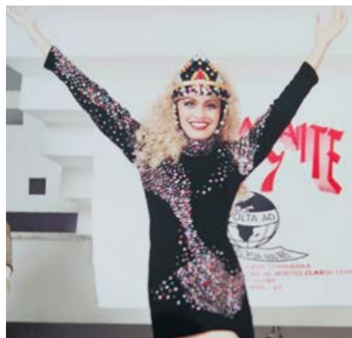
Elke Maravilha fazia muito sucesso no júri da Buzina do Chacrinha