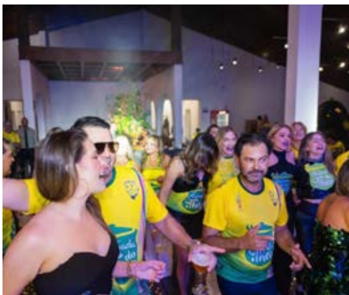
TODO salão do Clube dos Fazendeiros superlotado e todos animados pelas espetaculares bandas: "Samba da Rosa", Baile do PACCO" e "Two Night Samba".