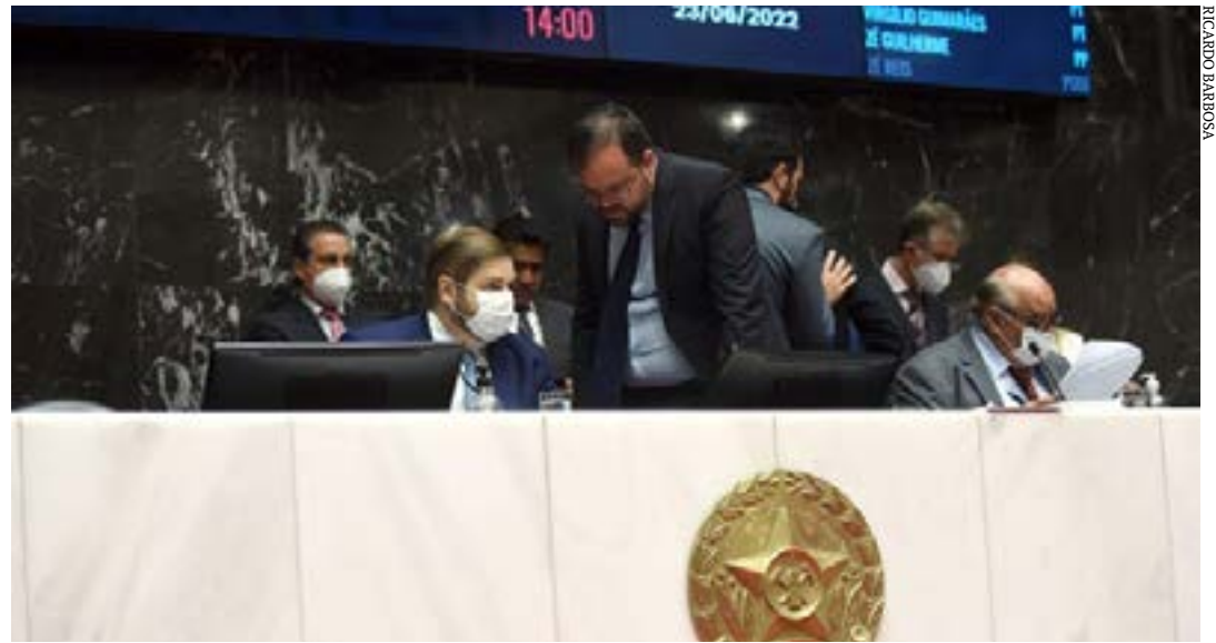
As novas normas são originárias de projetos aprovados pelo Plenário na reunião do dia 23 de junho

Também foi sancionada pelo governador Romeu Zema, nessa segunda-feira (18), a Lei 24.222, que beneficia pessoas com deficiência e com transtornos do espectro autista. Essa norma determina a adoção de medidas para promover a participação dessas pessoas em eventos culturais, exposições, sessões de cinema e teatro e espetácu-