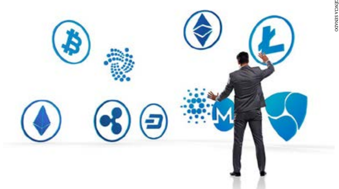
Segundo o projeto, o tabelião deverá consignar as informações na escritura e a determinação do valor

“Considerando a dimensão continental do nosso território, é fundamental uniformizar entendimentos, para evitar que os cidadãos sofram com os transtornos causados pela divergência de entendimentos”, afirma Rogério Carvalho. (Agência Senado)