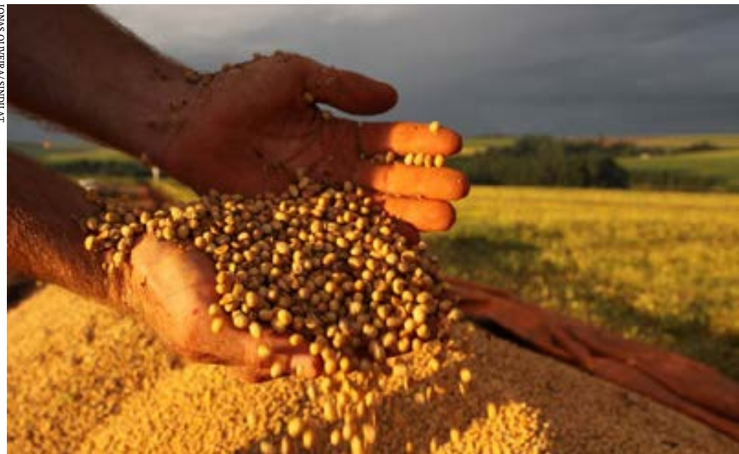
Entre as operações de financiamento do Plano Safra que serão beneficiadas com os recursos está o Pronaf

Para isso, é feita uma alteração na Lei 13.799, de 2000, que dispõe sobre a política estadual dos direitos da pessoa com deficiência. (Portal ALMG)