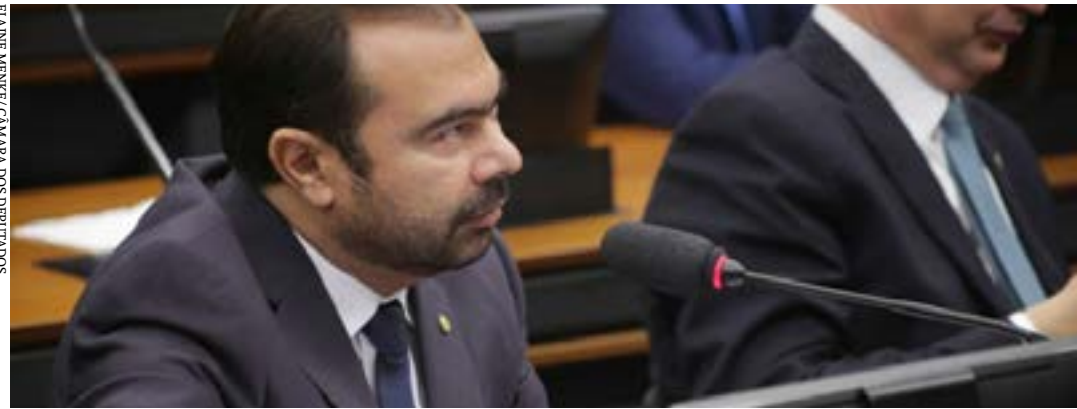
Alencar: contratação de professores temporários deve ficar restrita às situações especiais

O Projeto de Lei 1628/22 determina que estados, Distrito Federal e municípios preencham a totalidade dos cargos efetivos do magistério público da educação básica por meio de concurso público. O texto exige que os entes federais divulguem o quantitativo de cargos efetivos no magistério da educação básica, tanto de cargos ocupados quanto de cargos vagos. A proposta também prevê que seja divulgado o número de cargos efetivos cujos ocupantes este-