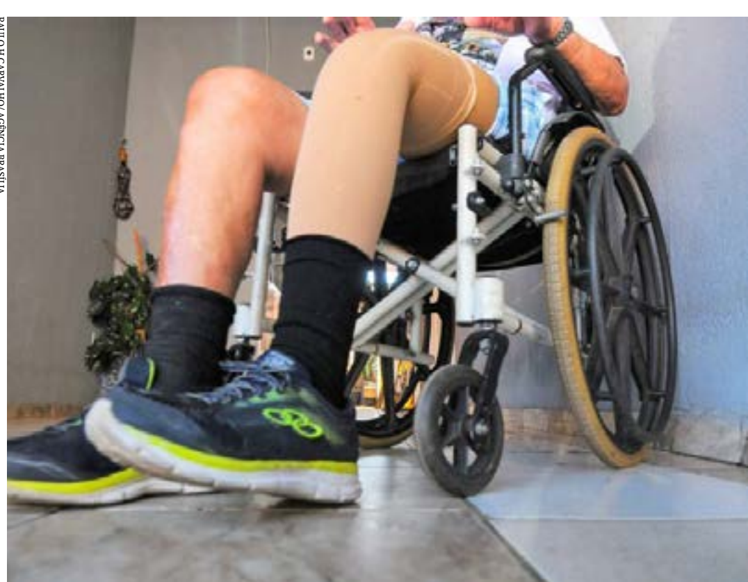
Pessoa com deficiência usando prótese e cadeira de rodas