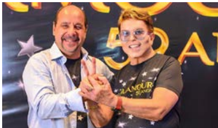
Fico contente, pois vários amigos já chegaram à cidade só para me prestigiar, como o ex-ministro da Saúde, Saraiva Felipe.