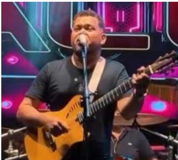
O Baile do Pacco mais uma vez estará dando aquele show, com repertório variado, inclusive sertanejo dos anos 60 etc.