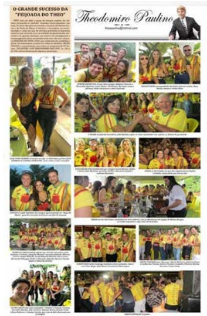
Vejam esta página do Diário quando a Feijoada foi realizada na última Copa do Mundo. Agora voltamos com a mesma cor.