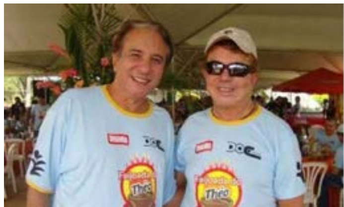
Como ontem eu estava a mil organizando o espetacular evento de logo mais, resolvi ilustrar esta página com momentos inesquecíveis.