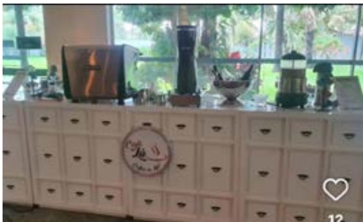
O famoso Café do Lu estará apresentando novidades.