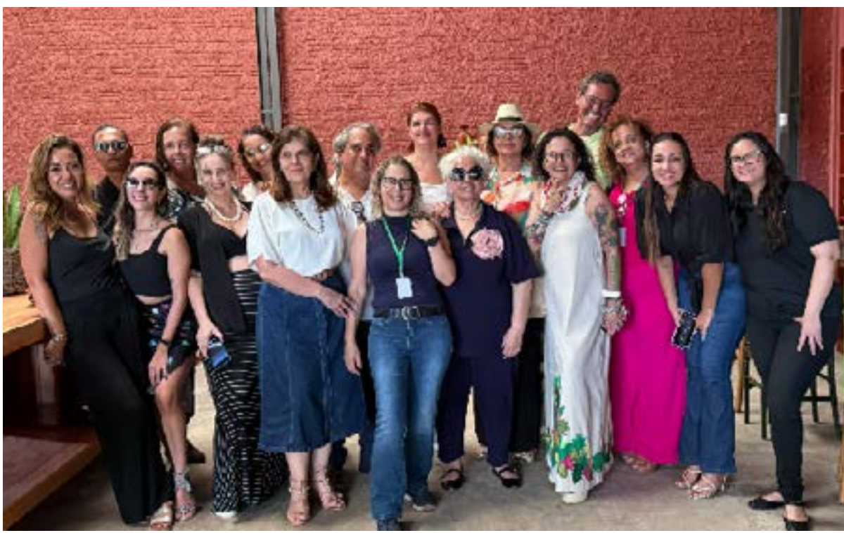
A cena da economia criativa e da gastronomia regional ganha destaque em Montes Claros com a realização do Bendito Prato, evento que integra o projeto Bendita Feira e que ainda acontece, reunindo sabores, cultura e experiências na Casa Bendita.

Feira gastronômica Bendito Prato segue com programação especial até hoje