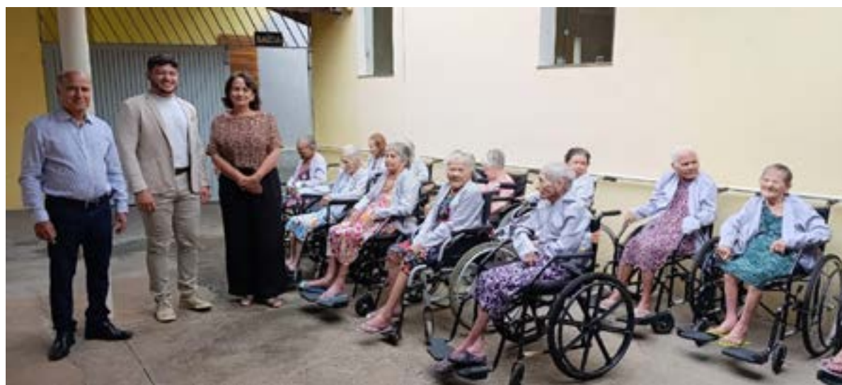
O Hospital Dilson Godinho (HDG) realizou, na manhã desta quinta-feira, 02 de abril, a entrega das doações arrecadadas por meio da campanha solidária de fraldas geriátricas ao Centro Feminino de Longa Permanência "Lar das Velhinhas", em Montes Claros.

Gesto coletivo reforça compromisso social e dignidade da Instituição com a terceira idade