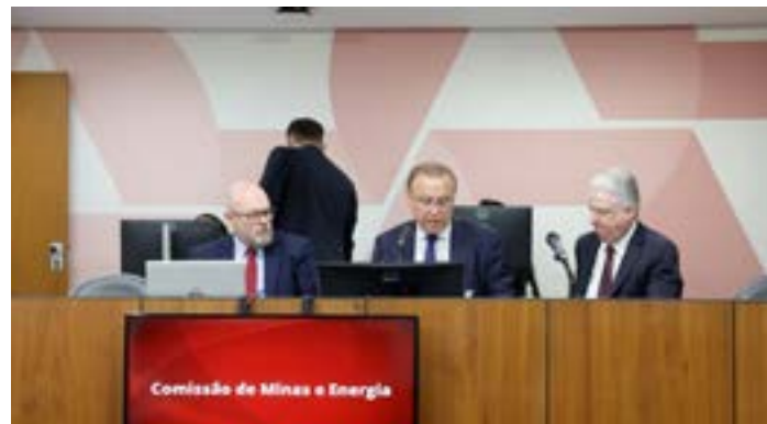
Deputado Gil Pereira (C) preside a Comissão de Minas e Energia, da Assembleia Legislativa (ALMG)

Aprovado no último dia 18/03/26, o Requerimento de Comissão (RQC) 20256/2026, de auto-