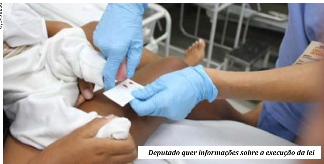
Deputado quer informações sobre a execução da lei

A Comissão de Seguridade Social e Família da Câmara dos Deputados promove audiência pública hoje (14), a partir de 9h, para discutir a Lei 14.154/21, que amplia o número de doenças rastreadas pelo teste do pezinho no Sistema Único de Saúde (SUS). A norma entrou em vigor no dia 27 de maio.