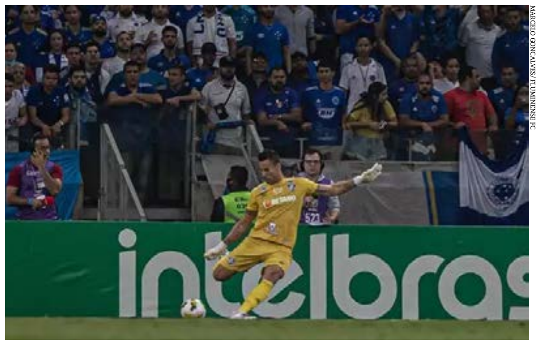
Goleiro Fábio, do Fluminense, em partida contra o Cruzeiro, pela Copa do Brasil

Pelo Cruzeiro, foram 17 anos ininterruptos, 976 jogos, 34 pênaltis defendidos e 12 títulos conquistados. Entre eles, estão: dois Brasileiros (2013 e 2014), três Copas do Brasil (2000, 2017 e 2018) e sete Campeonatos Mineiros (2006, 2008, 2009, 2011, 2014, 2018 e 2019). (Superesportes)