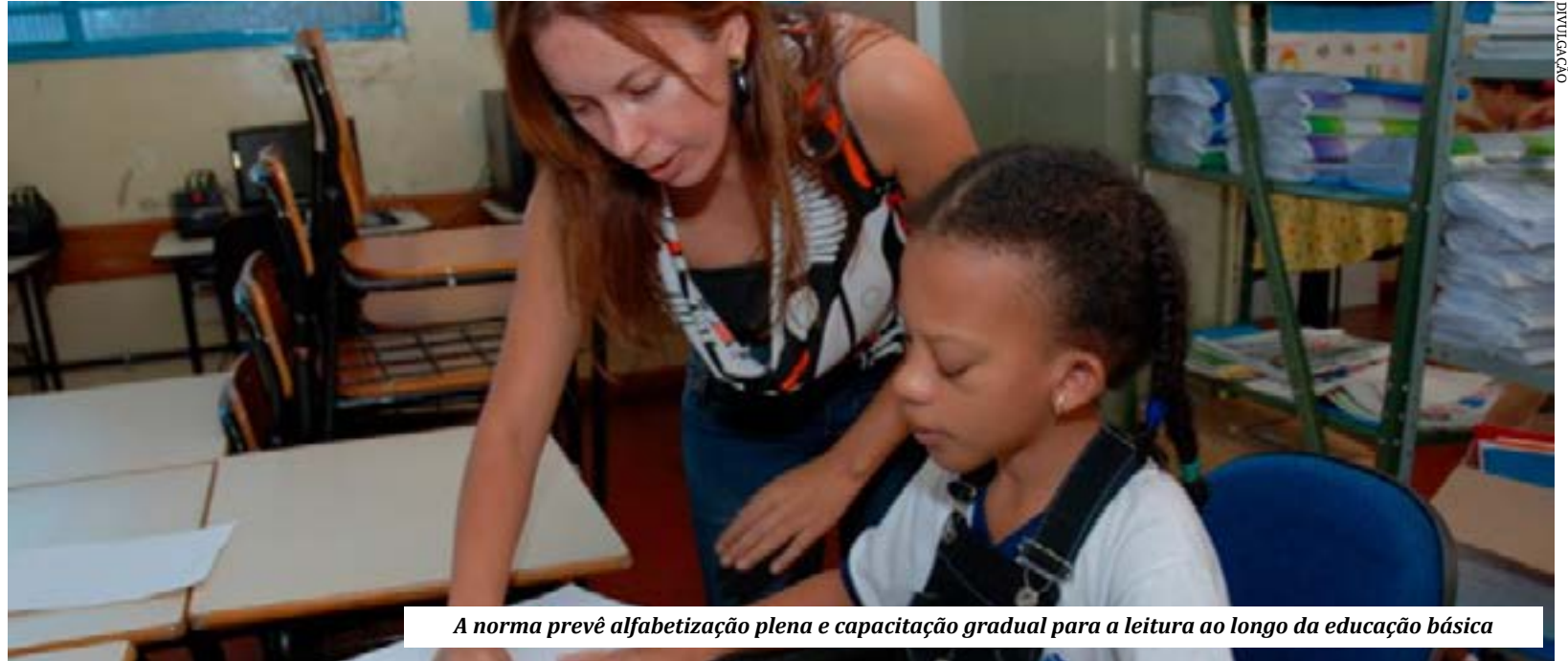
A norma prevê alfabetização plena e capacitação gradual para a leitura ao longo da educação básica

No dia da aprovação, o relator da proposta, senador Veneziano Vital do Rêgo (MDB-PB), ressaltou que as medidas são fundamentais para uma escolarização satisfatória, que proporcione condições de o cidadão progredir e dominar saberes de outras áreas. (Agência Senado)