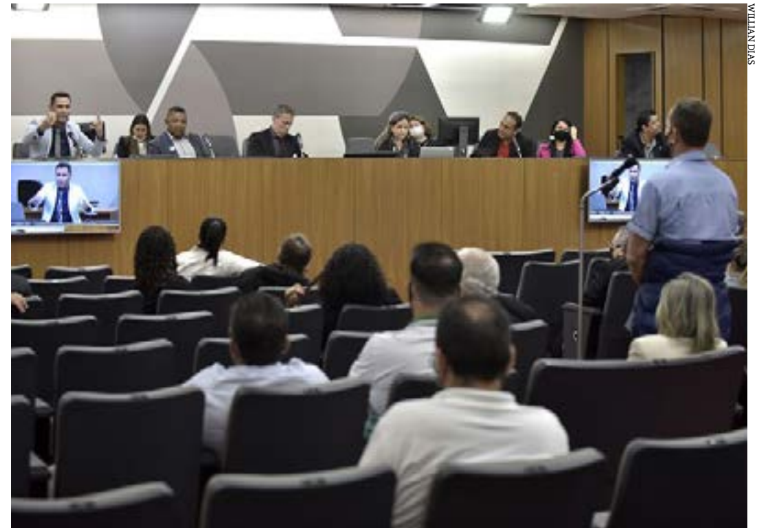
Parlamentares cobraram soluções da Prodemge, que se comprometeu a compilar e priorizar as queixas