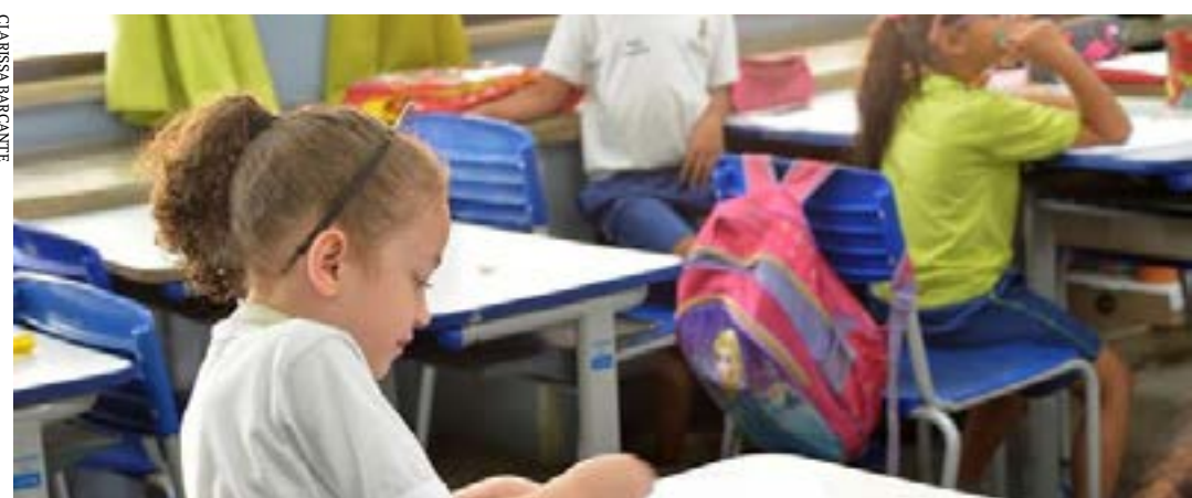
Ao questionar requerimento de fiscalização, deputado enalteceu as preocupações ambientais da empresa

Debater a importância da inserção da língua espanhola na grade curricular da Rede Estadual de Ensino. Este é o objetivo de audiência pública que a Comissão de Educação, Ciência e Tecnologia da Assembleia Legislativa de Minas Gerais (ALMG) vai realizar hoje (14), às 9 horas, no Auditório José Alencar.