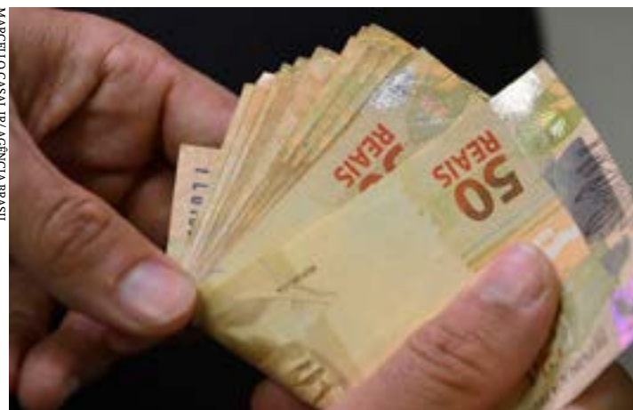
Gratificação foi criada em meio a disputa entre patrões e empregados

A Agência Brasil elaborou um guia com mais informações sobre o décimo terceiro, como quem tem direito e a forma como a gratificação é tributada.