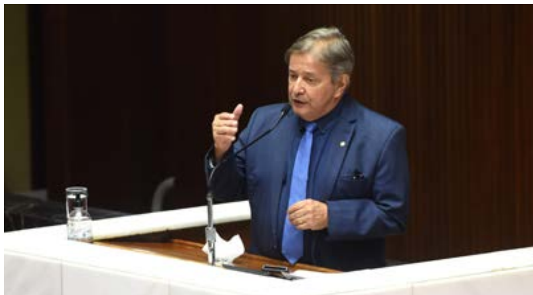
Ao questionar requerimento de fiscalização, deputado enalteceu as preocupações ambientais da empresa

do seu lado social e ambiental, atuando nas comunidades em que está inserido.