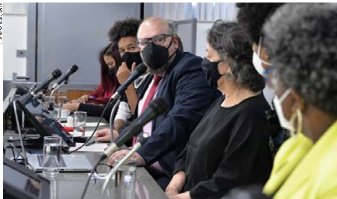
Os participantes da reunião da Comissão do Trabalho destacaram a importância do Estatuto da Criança e do Adolescente

Ir onde ninguém está indo. A coordenadora explicou que as políticas precisam alcançar os territórios onde há ausência do poder público.