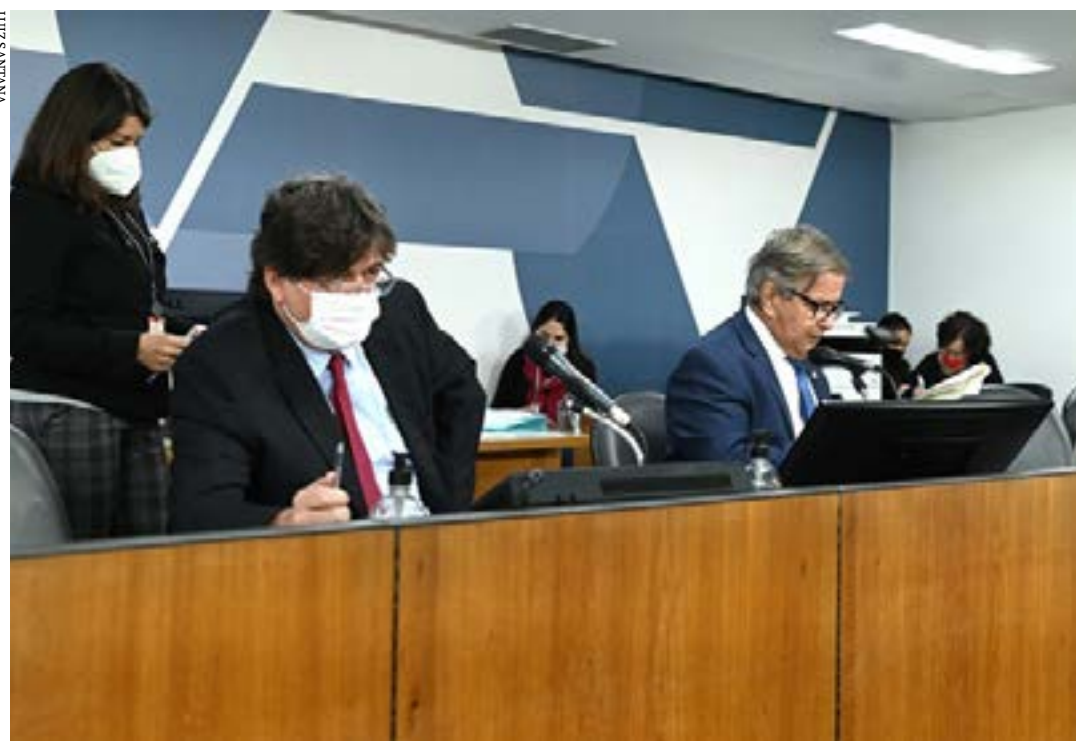
Os deputados também aprovaram pareceres a projetos sobre teste de zika e chikungunya e sobre fundo para pesquisas relacionadas à Covid-19

O texto segue para análise da Comissão de Fiscalização Financeira e Orçamentária (FFO). (Portal ALMG)