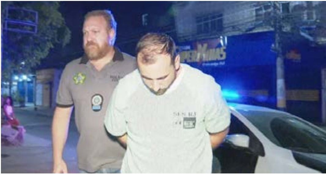
O médico anestesista foi preso e colocado à disposição da Justiça