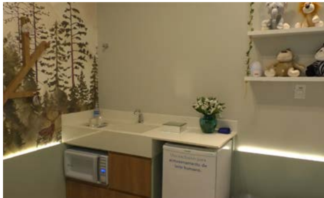
Espaço de Apoio ao Aleitamento Materno da Novo Nordisk