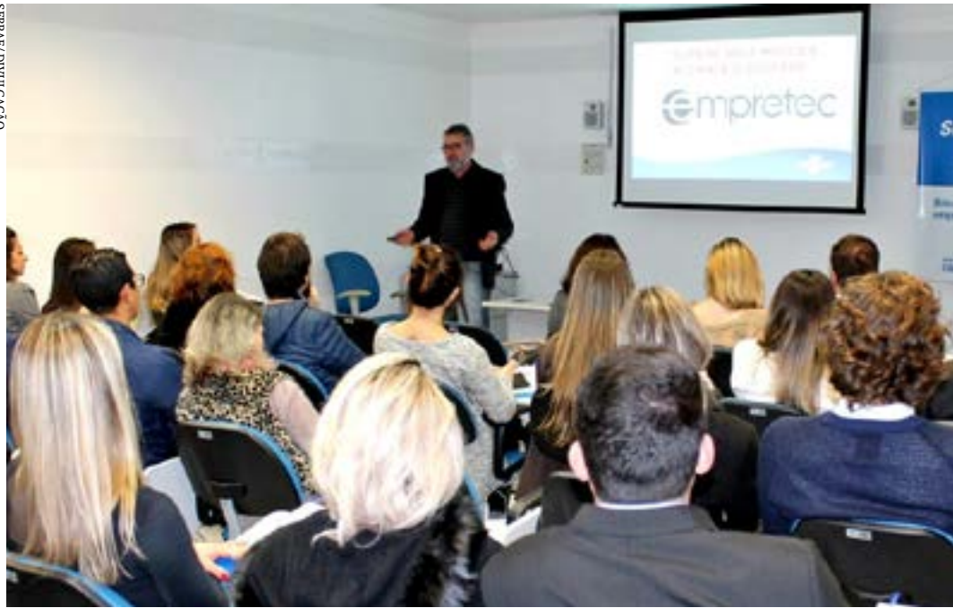
Seminário de capacitação em empreendedorismo com metodologia da ONU é realizado pelo Sebrae Minas

O Sebrae Minas está com inscrições abertas para o Empretec, que acontece entre os dias 18 e 23 de julho, em Montes Claros. As vagas