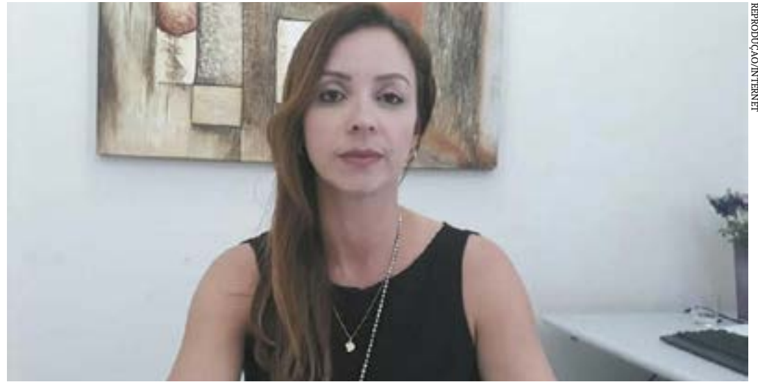
Há muito tempo que o estupro deixou de ser só conjunção carnal, qualquer outro ato libidinoso também pode configurar estupro", explica a delegada