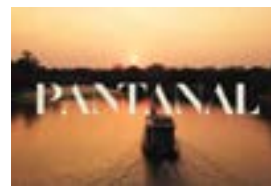
José Lucas que se o peão ganhar a sela do avô terá Juma em seus braços.

Juma não demonstra nenhuma satisfação ao experimentar o vestido de noiva. Maria Bruaca sugere que Tenório contrate um peão para manter o gado na cerca. Jove esconde o filme onde está o registro do Velho do Rio, que fica decepcionado com a atitude do rapaz. O Velho do Rio comunica a Jove que ele nunca mais o verá. Nenhum dos peões de José Leônico aceita trabalhar para Tenório. Maria Bruaca dorme com Alcides depois de ser expulsa do quarto por Tenório. Trindade diz a