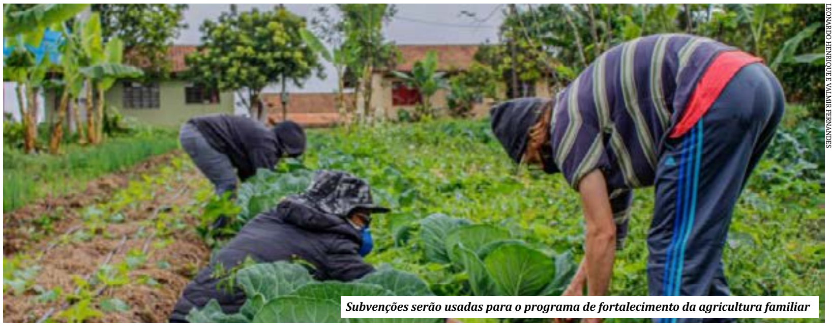
Subvenções serão usadas para o programa de fortalecimento da agricultura familiar

Os recursos aprovados serão repartidos entre as seguintes operações de financiamento do Plano Safra: Pronaf: R$ 532 milhões, Custeio agropecuário: R$ 443,5 milhões, Investimento rural e agroindustrial: R$ 216,5 milhões e Comercialização de produtos agropecuários: R$ 8 milhões. (Agência Câmara)