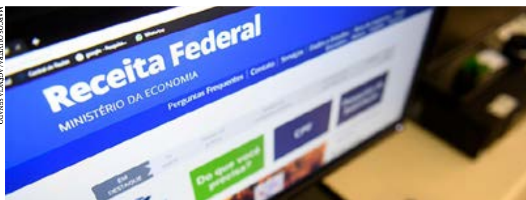
A GFIP é um guia que tem de ser entregue à Receita Federal

Após a derrubada de veto pelo Congresso Nacional, foi promulgada em edição extra do Diário Oficial da União (DOU), a Lei 14.397, de 2022, que anistia infrações e multas aplicadas a empresas por atraso na entrega da Guia de Recolhimento do Fundo de Garantia do Tempo de Serviço e Informações à Previdência Social (GFIP).