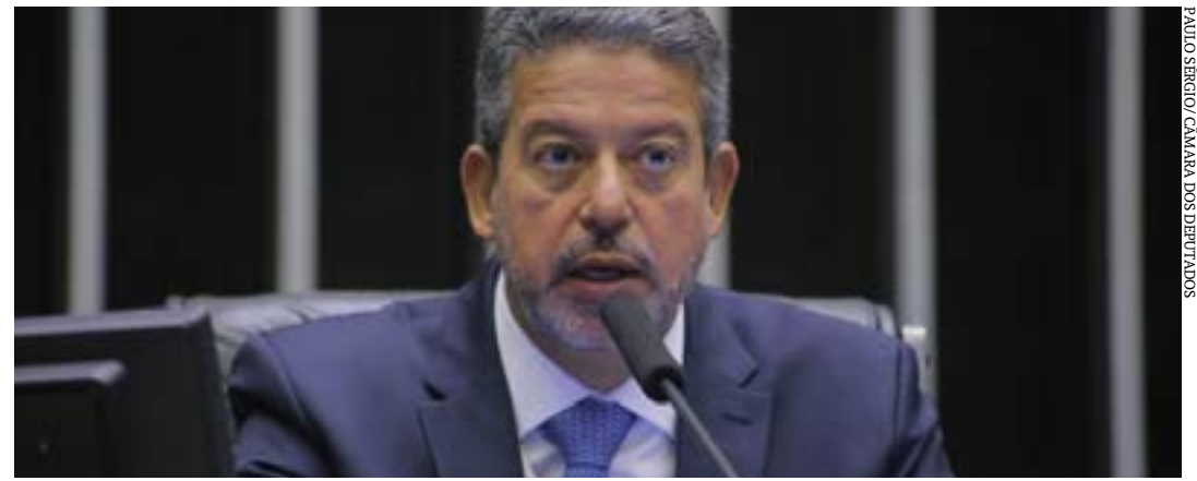
Lira: "Conclamo a todos pela paz para fazer nossas escolhas políticas"