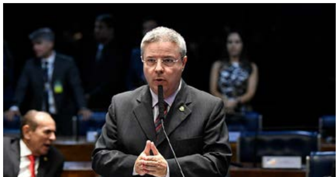
Projeto que deu origem à nova lei foi relatado pelo ex-senador Antonio Anastasia

A Lei do IPI (Lei 7.798, de 1989) determina que o valor tributável não poderá ser inferior ao preço corrente no mercado atacadista da “praça” da empresa. O objetivo da norma é evitar a manipulação de preços entre esses estabelecimentos para reduzir o valor da operação de saída dos produtos do estabelecimento industrial para o estabelecimento revendedor desses bens, em prejuízo da arrecadação do IPI. (Agência Senado)