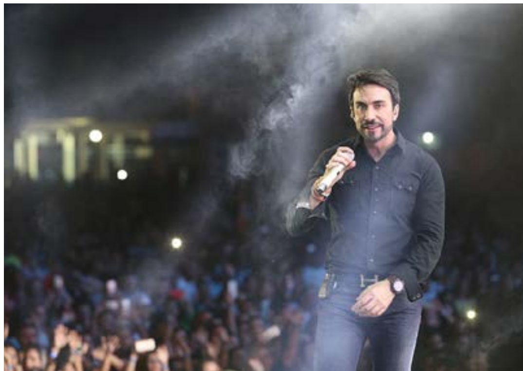
O show será uma ação social

Além das doações pontuais do show do Padre Fábio de Melo, o Mesa Brasil Sesc continua com seu trabalho diário de captação de alimentos, seja de doadores em pessoa física, ou empresas, produtores rurais em Montes Claros e região. A missão do programa é atenuar os índices de baixo desenvolvimento e da vulnerabilidade social e levar mais segurança, cada vez mais, à mesa das pessoas.