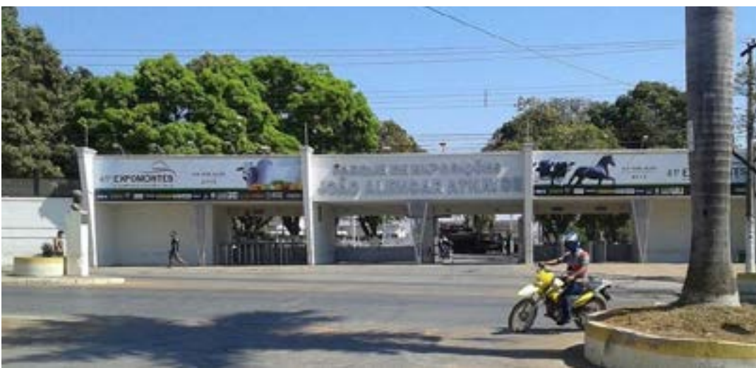
Os vendedores foram orientados de que não poderiam instalar suas barracas na frente do Parque, conforme ocorre todo ano

Ainda durante a 48ª Expomontes, que ocorre até o próximo dia 10 deste mês, no Parque de Exposições João Alencar Athayde, outra polêmica envolveu a MCTrans, que, segundo denúncias, teria atrapalhado trabalhadores de montarem barracas e venderem seus produtos no parque, confor-