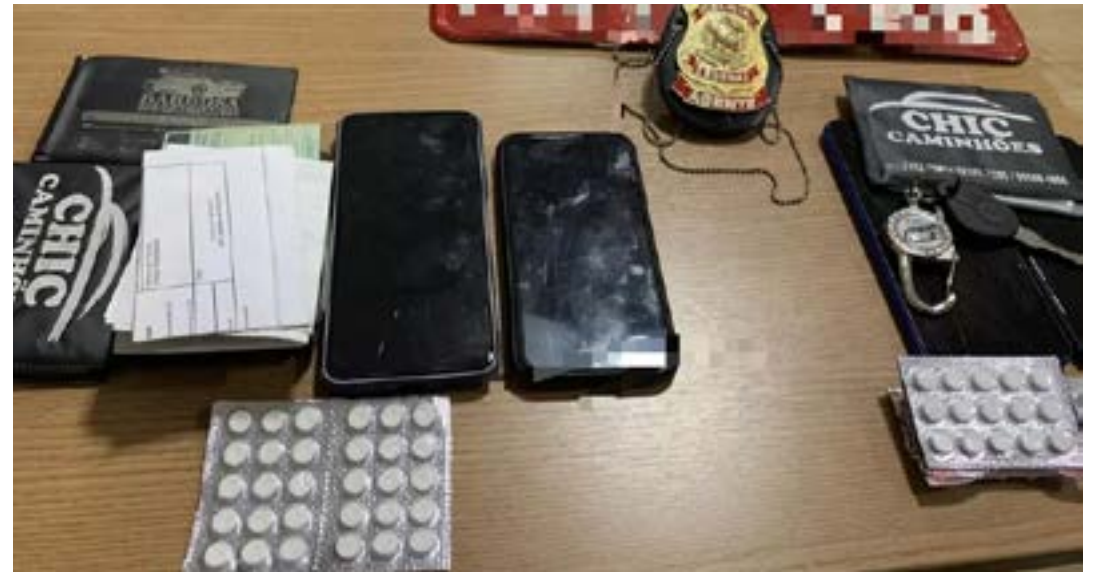
PF também apreendeu 100 comprimidos de rebite

a Delegacia da Polícia Federal e em seguida, encaminhados ao sistema prisional, onde estão à disposição da Justiça.