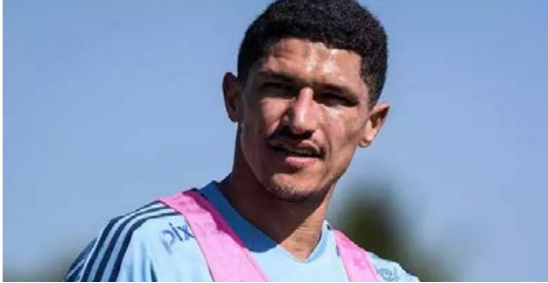
Luvannor deve receber nova oportunidade entre os titulares do Cruzeiro