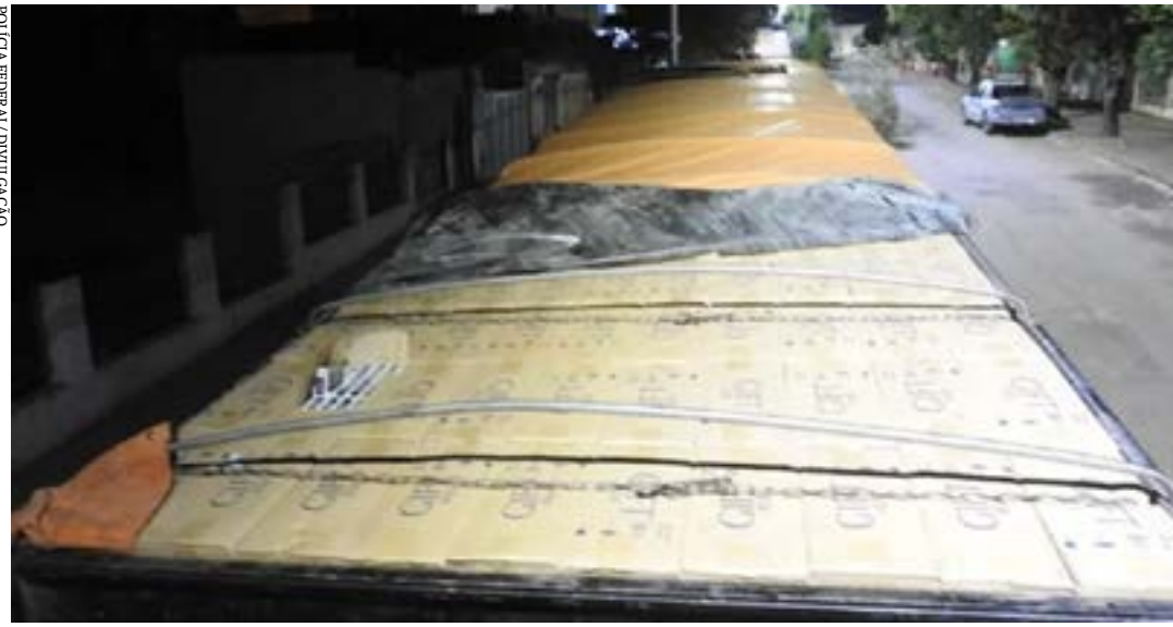
Caminhões carregados com cigarros foram apreendidos pela Polícia Federal

A Polícia Federal apreendeu dois caminhões carregados com cigarros contrabandeados do Paraguai na BR-251, entre Montes Claros e Francisco Sá. Três homens foram presos em flagrante.