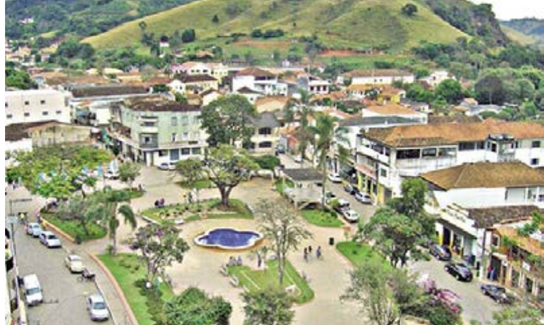
Catuti receberá R$ 650 mil proveniente de repasse do acordo com a Vale em reparação aos danos causados com o rompimento da Barragem de Brumadinho