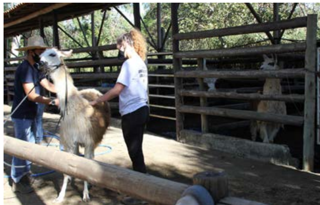
Os acadêmicos aprenderam os cuidados com as llamas. Animais também vão para a exposição agropecuária