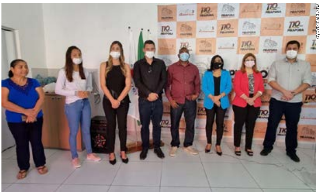
Projeto regularizará três mil imóveis em Pirapora

Os bairros contemplados, nessa primeira etapa, são: Bom Jesus II, Santos Dumont, São Geraldo, Nª Senhora do Rosário, Cinquentenário, Cidade Jardim, São João e Nossa Sra. Aparecida. (Ascom PMP)