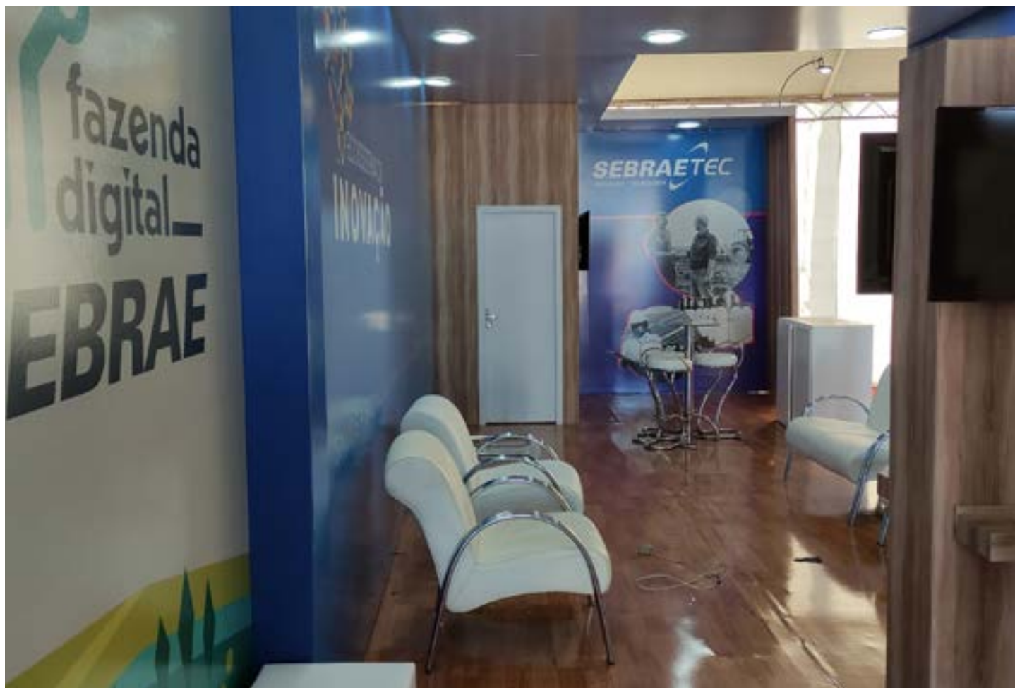
Participantes terão acesso a produtos e serviços para melhorar a gestão e a competitividade dos empreendimentos rurais

Parque de Exposições João Alencar Athayde durante os 11 dias de evento, além de uma movimentação em torno de R$ 400 milhões em leilões e negócios.