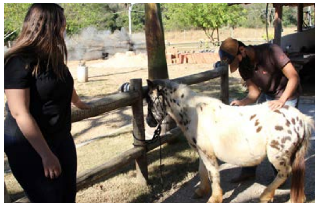
Acadêmicos cuidam dos pôneis que irão para a Expomontes

Animais domésticos, como diferentes raças de cachorros, também estarão no parque nos dias de exposição. Para os produtores rurais, o professor explicou que será apresentado um trabalho que está sendo desenvolvido com cabras leiteiras no Norte de Minas. "Alguns produtores de São Paulo, do Rio