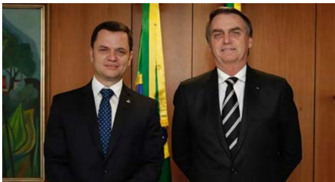
O ministro da Justiça e Segurança Pública, Anderson Gustavo Torres (esq.) e o Presidente da República, Jair Messias Bolsonaro (dir.)