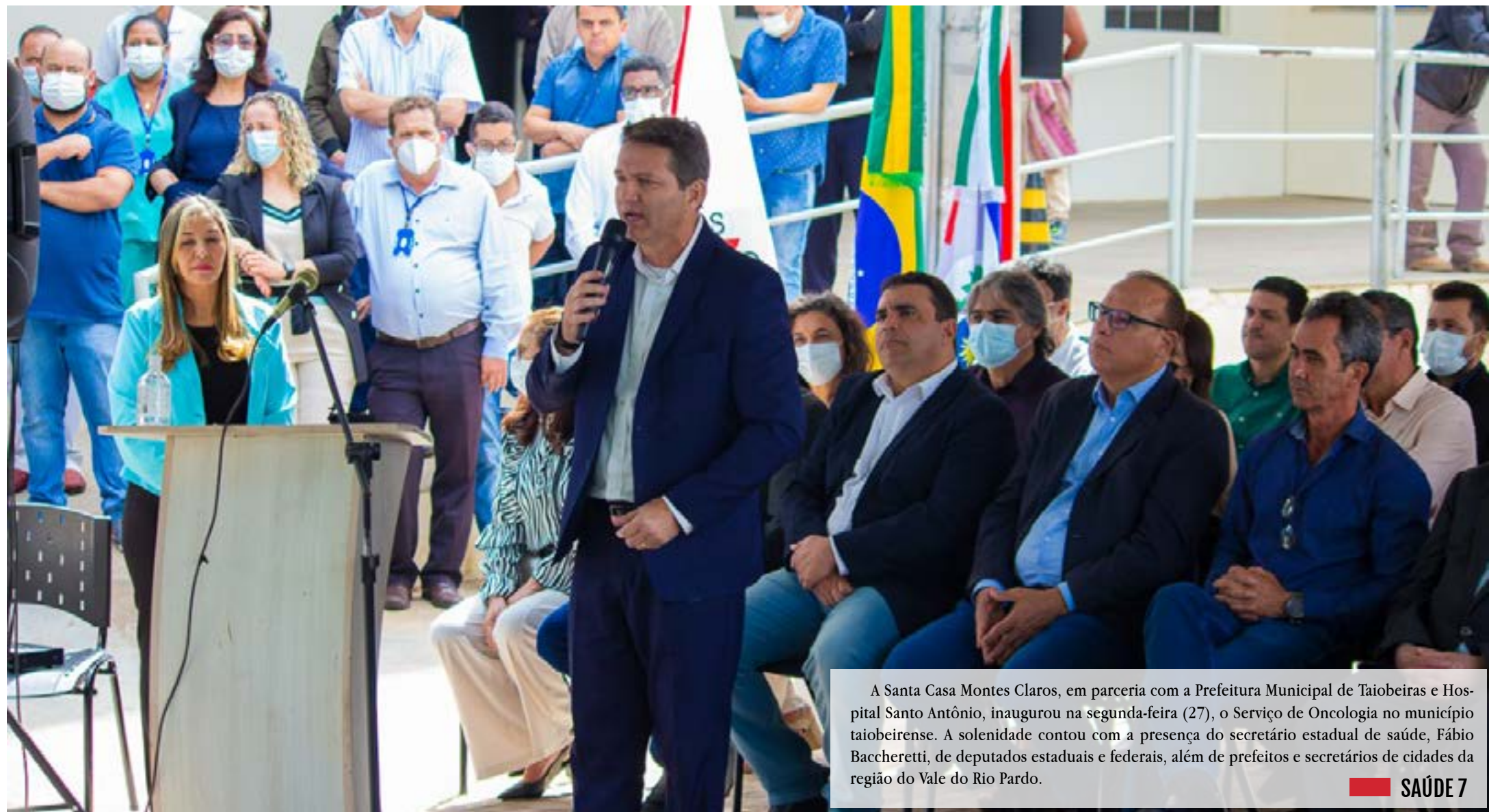
A Santa Casa Montes Claros, em parceria com a Prefeitura Municipal de Taiobeiras e Hospital Santo Antônio, inaugurou na segunda-feira (27), o Serviço de Oncologia no município taiobeirense. A solenidade contou com a presença do secretário estadual de saúde, Fábio Baccheretti, de deputados estaduais e federais, além de prefeitos e secretários de cidades da região do Vale do Rio Pardo.