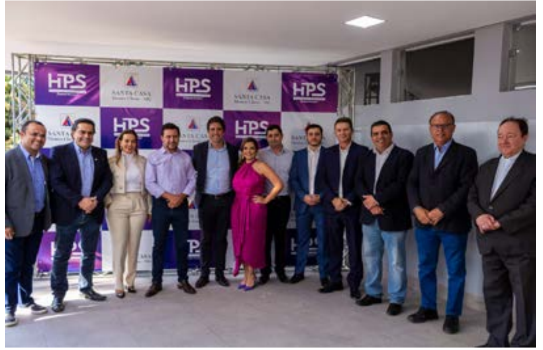
A inauguração do serviço oncológico em Taiobeiras

A Santa Casa Montes Claros e a Policlínica Salinense celebraram na segunda-feira (27), o Termo de Intenções com o intuito de expandir o atendimento médico-hospitalar na região do município de Salinas. A iniciativa acontece no momento em que a Policlínica comemora seus 50 anos de fundação e reinaugura suas novas instalações.