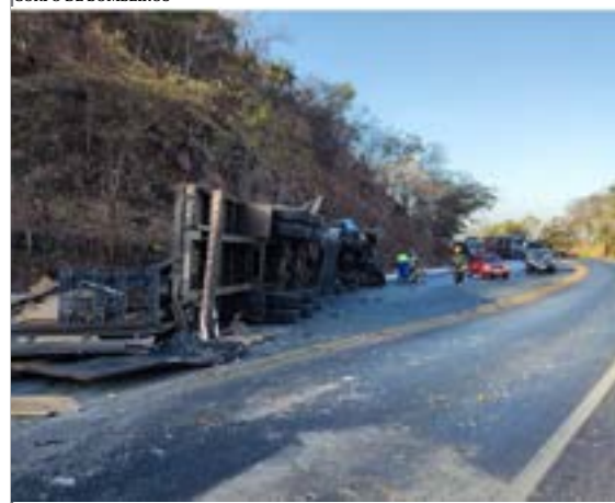
CORPO DE BOMBEIROS