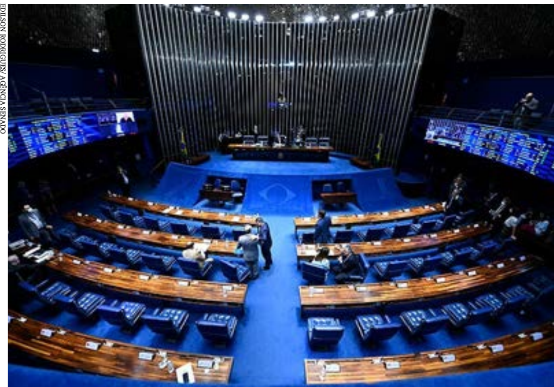
Pauta do Plenário ainda inclui matérias que tratam de regras do Pronatec, da criação da Semana Nacional de Conscientização sobre o TDAH e da desjudicialização da execução de títulos

TÍTULOS JUDICIAIS - Também está na pauta o PL 6.204/2019, da senadora Soraya Thronicke (União-MS), que permite que execuções civis de títulos extrajudiciais e cumprimentos de sentença passem a tramitar nos cartórios de protesto. O PL 6.204/2019 cria a figura do agente de execução de títulos judiciais e extrajudiciais para atuar e resolver as demandas nos cartórios de protesto. Essa função seria exercida pelos tabeliães de protestos localizados onde tramitem os respectivos procedimentos executivos. O relator do texto é o senador Marcos Rogério (PL-RO). (Agência Senado)