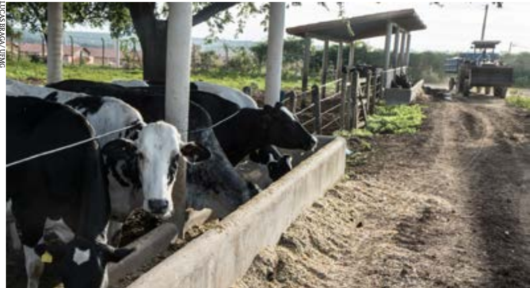
Dia de campo sobre Bovinocultura é uma realização do programa de extensão Pecuária do Sertão, do Instituto de Ciências Agrárias da UFMG

Os interessados podem buscar mais informações sobre o evento no Cenex pelo telefone, (38) 2101-7745 ou pelo e-mail, cenex@ica.ufmg.br. (ANA CLÁUDIA MENDES/ UFMG)