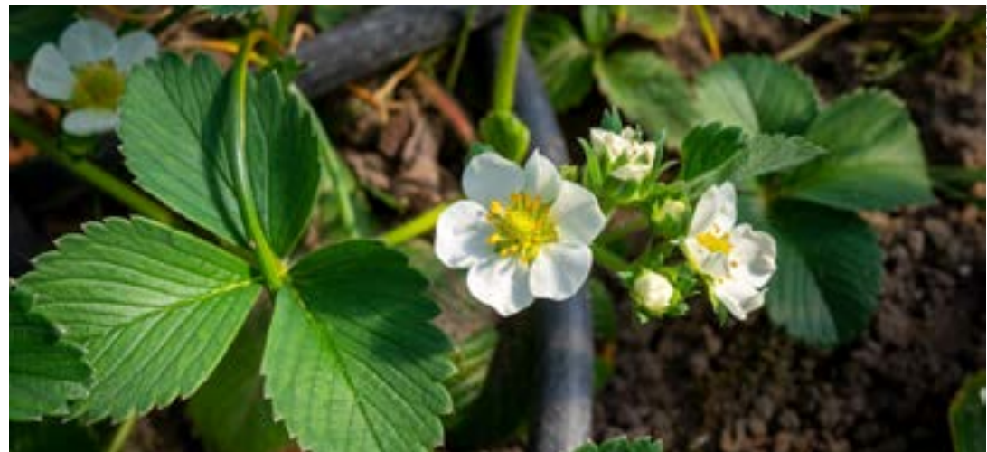
Interessados em obter o reconhecimento devem solicitar via termo de declaração

do solo; o uso racional e qualidade da água; o uso correto de insumos; o manejo integrado de pragas; e a rastreabilidade do processo produtivo com registros e controles da produção.