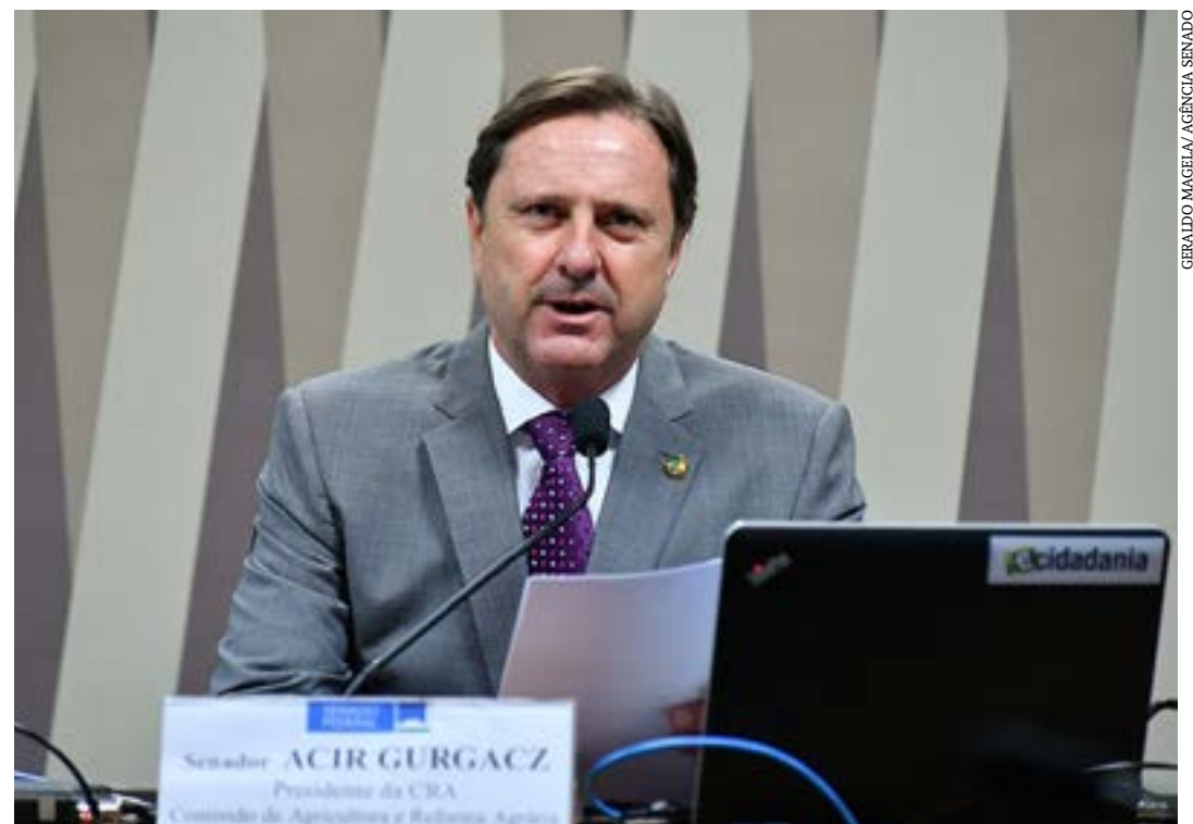
O relator é o senador Acir Gurgacz

cultura, Pecuária e Abastecimento; da Agência Nacional de Vigilância Sanitária (Anvisa); e do Instituto Brasileiro do Meio Ambiente e dos Recursos Naturais Renováveis (Ibama). (Agência Senado)