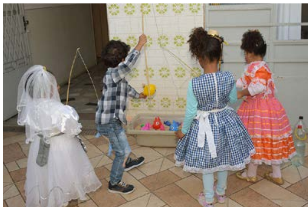
Crianças brincam de pescaria durante festa junina, em abrigo mantido pelos servidores do TJMG