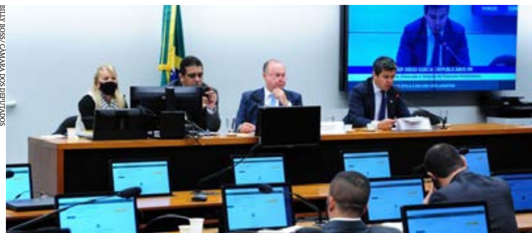
Conselho de Ética da Câmara dos Deputados

O Conselho de Ética e Decoro Parlamentar da Câmara dos Deputados reúne-se nesta terça-feira (21) para leitura, discussão e votação de pareceres preliminares.