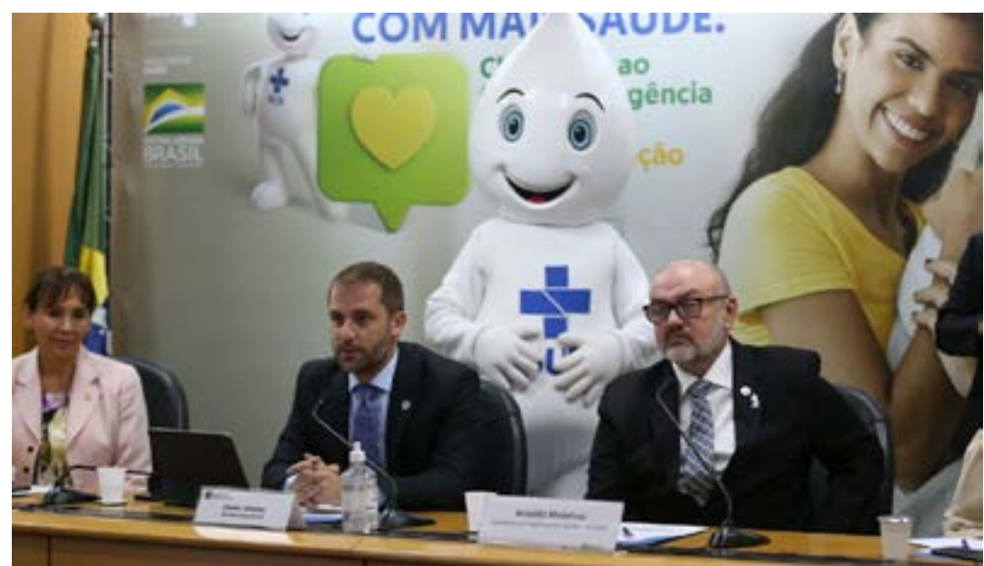
Ministério da Saúde pede à população que tome todas as doses da vacina

No início do ano, quando o país enfrentava a primeira onda da variante Ômicron, o Ministério da Saúde constatou que pessoas não vacinadas estavam entre seis e nove vezes mais suscetíveis, de acordo com a faixa etária, a desenvolver manifestações graves da doença na comparação com pessoas imuniza-