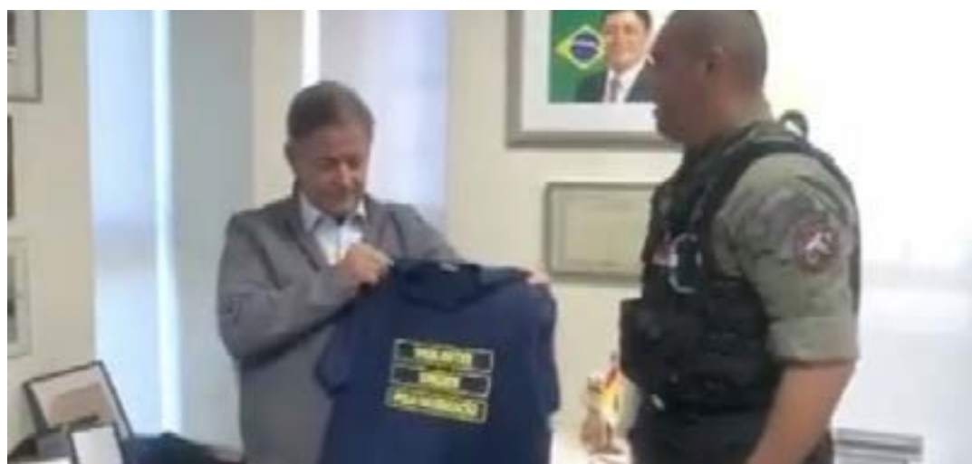
Parlamentar reconhece o risco inerente à atividade exercida pelos vigilantes de empresas privadas.

No próximo dia 30, vigilantes do estado vão se reunir em um Ato Público, na Assembleia Legislativa, para levar para a população e aos parlamentares suas reivindicações, ou seja: Porte de arma, aposentadoria especial, respeito à vida e contra a usurpação do trabalho do vigilante por pessoas despreparadas. (MARGARIDA MAGALHÃES - Colaboradora)