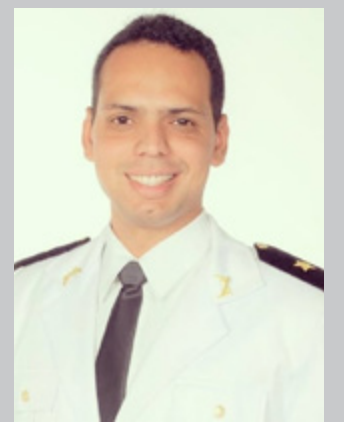
(* Capitão PM - Comandante da 210ª Cia/10º Batalhão PM.

Nesse desenvolvimento há que se contextualizar que em âmbito espiritual, o próprio Jesus Cristo ao se voltar a multidão, em uma passagem na Bíblia Sagrada em João 08-12, nos instrui, “Eu sou a luz do mundo. Quem me segue, nunca andará em trevas, mas terá a luz da vida”. E para completar esse valioso entendimento, o ativista americano Mahatma Gandhi nos orienta que “a minha fé, nas densas trevas, respaldada ainda mais viva”. Então a chave é crer, é ver a vida com esperança de que há muito mais por viver, por experimentar e junto aos que nos rodeiam e, desse modo, contribuir para a transformação de uma realidade, por vezes, inóspita para uma existência muito mais repleta de sentido e de propósito.