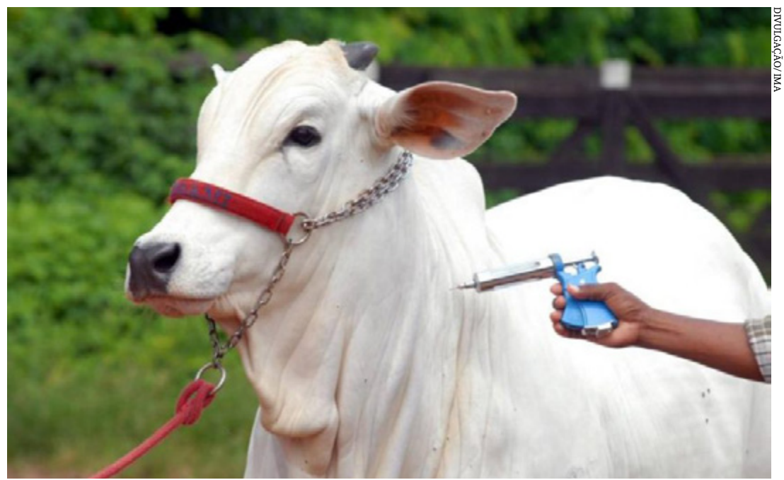
Produtores devem imunizar fêmeas bovinas e bubalinas de 3 a 8 meses de idade e comprovar o procedimento ao IMA até 10/7

A médica veterinária acrescenta que para alcançar bons resultados é essencial a mobilização dos produtores, estabelecimentos que vendem vacina, médicos veterinários autônomos cadastrados e vacinadores. “O controle da doença nos rebanhos