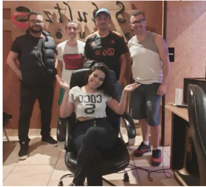
"Essa galerinha aqui é responsável pela produção desse trabalho [meu primeiro disco]; pessoas e profissionais incríveis", conta a cantora