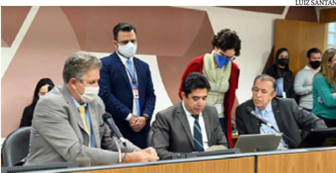
Os deputados presentes à reunião reforçaram os avanços trazidos pela PEC e garantiram que se empenharão em mais conquistas para a Polícia Penal

dro de servidores da Polícia Penal será preenchido por concurso público e que as promoções seguirão o critério alternado de antiguidade e merecimento. Além disso, o texto prevê que o órgão, dotado de autonomia administrativa, será dirigido por policial penal em atividade, na classe final da carreira e bacharel em direito.