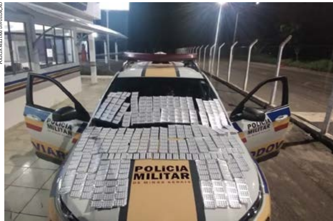
Comprimidos de 'rebite' estavam em uma caixa atrás do banco do passageiro