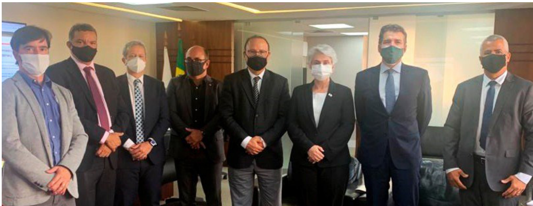
Em março de 2021, no Ministério Público Estadual, quando foi criado o grupo institucional de trabalho para resolver a questão fundiária em 11 municípios norte-mineiros