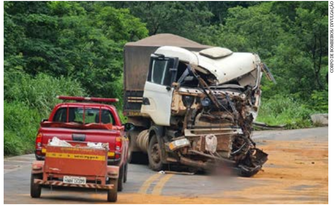
Vítima foi socorrida pelos bombeiros, mas não resistiu

Ainda de acordo com os bombeiros, houve derramamento de óleo dos tanques dos dois veículos e foi necessário jogar serragem na pista para eliminar os riscos de derapagem. O acidente foi na altura do km-4, no local conhecido como Ponte Branca.