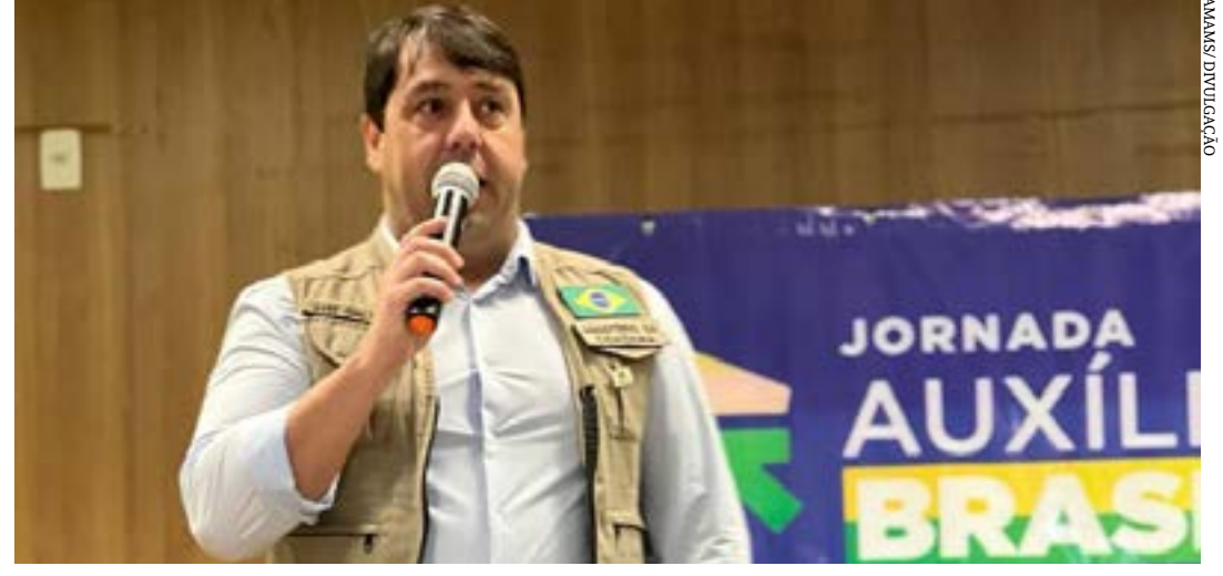
O ministro substituto do Ministério da Cidadania, Luiz Galvão, palestrou no evento

Uma articulação da Associação dos Municípios da Área Mineira da Sudene (Amams) resultou na realização da rodada de apresentações sobre os programas de transferência de renda e das políticas de assistência social do Governo Federal, evento de dois dias, encerrou nessa quarta-feira (15), no auditório da Amams, e que já ocorreu em vários estados. Cerca de 300 representantes do setor de Assistência Social, entre prefeitos, secretários municipais e gestores públicos de 89 mu-