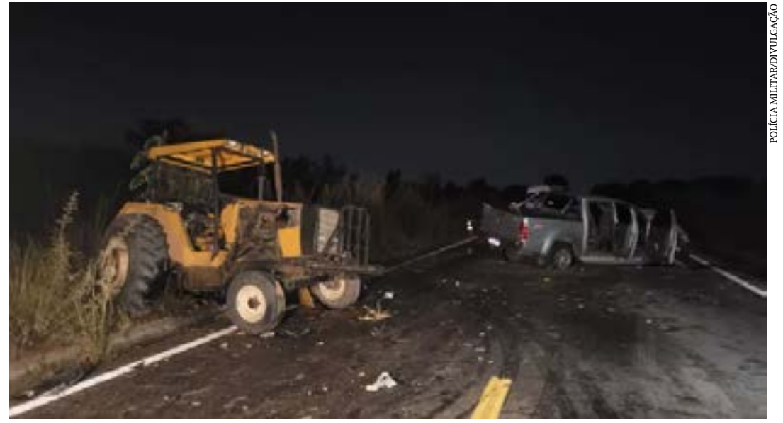
Dois pessoas morreram e três ficaram feridas na MGC-479

MGC-479 | Em outro grave acidente, que envolveu uma cami-