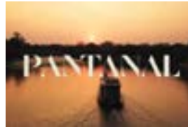
José Lucas seu mau pressentimento.

José Leôncio incentiva Jove a se casar com Juma. Tadeu diz a Filó que se sente menos filho de José Leôncio que os outros dois irmãos. Guta conta para Tenório sobre o término do namoro com Tadeu. Renato atíça Zuleica a reivindicar seus direitos como esposa de Tenório. Guta chama Zefa de sonsa e a culpa pelo término do namoro com Tadeu. Maria Bruaca seduz Alcides. Jove leva Juma para a fazenda. Juma diz a José Leôncio que o Velho do Rio se parece com José Lucas. Trindade compartilha com