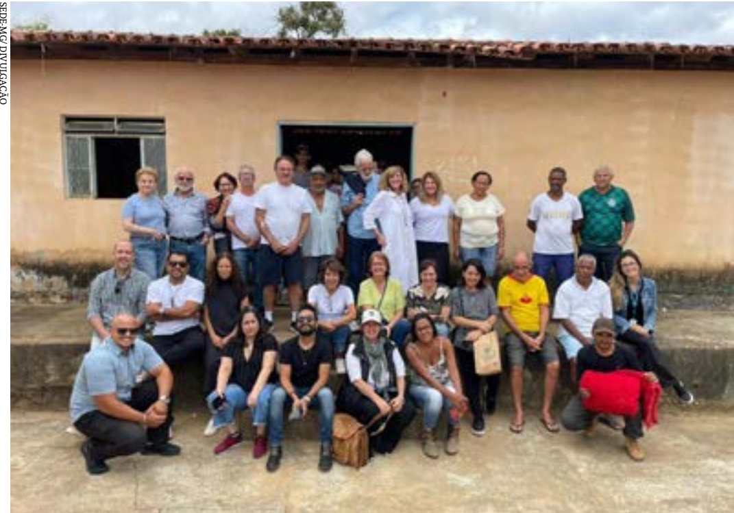
A expedição percorreu quase 2 mil quilômetros para visitar 43 núcleos de produção

No final do ano passado, o Sebrae Minas apoiou a criação da marca território "Vale do Jequitinhonha", com o objetivo de dar mais visibilidade e reconhecimento no mercado. A proposta do trabalho, em parceria com quatro associações, é tornar os artesãos protagonistas, destacando a origem como diferencial para valorizar ainda mais o artesanato e contribuir para o desenvolvimento da região. (Agência Minas)