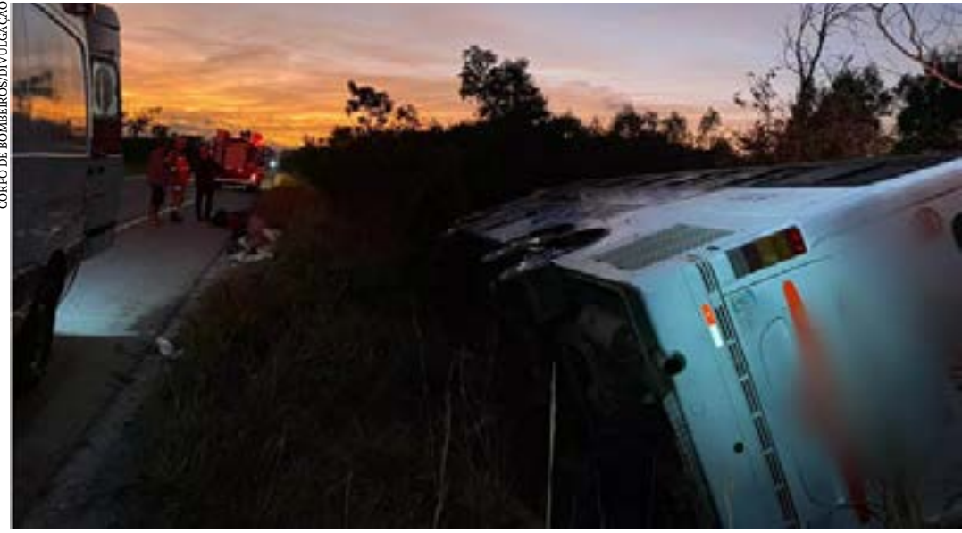
Havia 30 pessoas no ônibus que tombou na BR-251; motorista dormiu ao volante