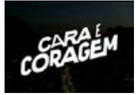
Moa decide contar toda a verdade para Rico e explica sobre a pasta com a fórmula. Rebeca descobre que Chiquinho está na casa de Milton, pai de Moa. Danilo manda investigar a vida de Duarte. O segurança da siderúrgica avisa a Martha que a empresa foi invadida. Ítalo, Pat e Moa concordam quando Rico diz que quer mostrar a foto de Clarice para Teca. Renan briga com Lou na frente dos bailarinos, e Ísis adora. Pat convida Lou para almoçar. Moa se irrita ao ver Rebeca na casa de Milton. Rico e Ítalo procuram fotos de Clarice e Leonardo nos pertences de Teca. Duarte conta sobre Anita para Jéssica. Vini incentiva Martha a deixar a presidência da empresa com Leonardo.

José Leôncio incentiva Jove a se casar com Juma. Tadeu diz a Filó que se sente menos filho de José Leôncio que os outros dois irmãos. Guta conta para Tenório sobre o término do namoro com Tadeu. Renato atíça Zuleica a reivindicar seus direitos como esposa de Tenório. Guta chama Zefa de sonsa e a culpa pelo término do namoro com Tadeu. Maria Bruaca seduz Alcides. Jove leva Juma para a fazenda. Juma diz a José Leôncio que o Velho do Rio se parece com José Lucas. Trindade compartilha com