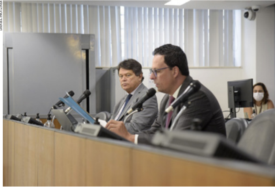
A Comissão de Defesa dos Direitos da Pessoa com Deficiência se reuniu na quinta-feira (10)

A Comissão de Defesa dos Direitos da Pessoa com Deficiência da Assembleia Legislativa de Minas Gerais (ALMG) aprovou, na quinta-feira (10), parecer de 1º turno favorável ao Projeto de Lei (PL) 3.596/22, que estabelece penalidades administrativas às pessoas físicas ou jurídicas e agentes públicos que discriminem as pessoas com transtorno do espectro autista (TEA).