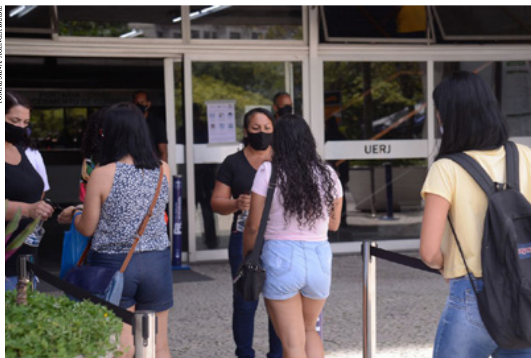
Aluno com doença infectocontagiosa não deve comparecer às provas

"Nesse momento, seria obrigatório o uso da máscara por pessoa que têm sinais ou sintomas de infecção respiratória, quem tem sinal ou sintoma de qualquer enfermidade", diz. Além disso, ele recomenda que usem máscara pessoas imunodeficientes ou com outras condições que as tornem suscetíveis a essas doenças. (Agência Brasil)