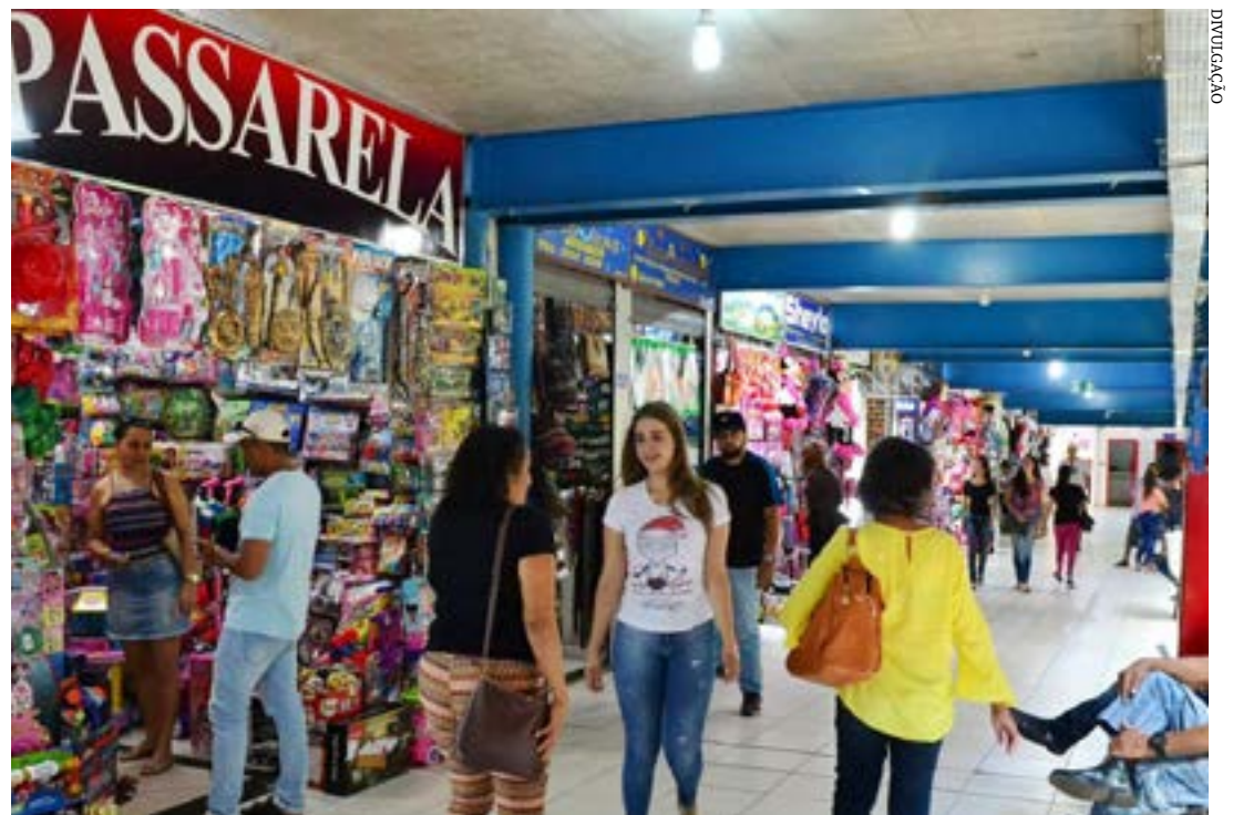
Montes Claros registrou 1877 contratações; segmento respondeu por 7 em cada 10 vagas criadas em Minas Gerais no primeiro semestre

As ocupações com melhores saldos de empregos no segmento foram: servente de obras (7.287), faxineiro (5.013) e alimentador de linha de produção (5.511). (Com informações da Agência Sebrae)