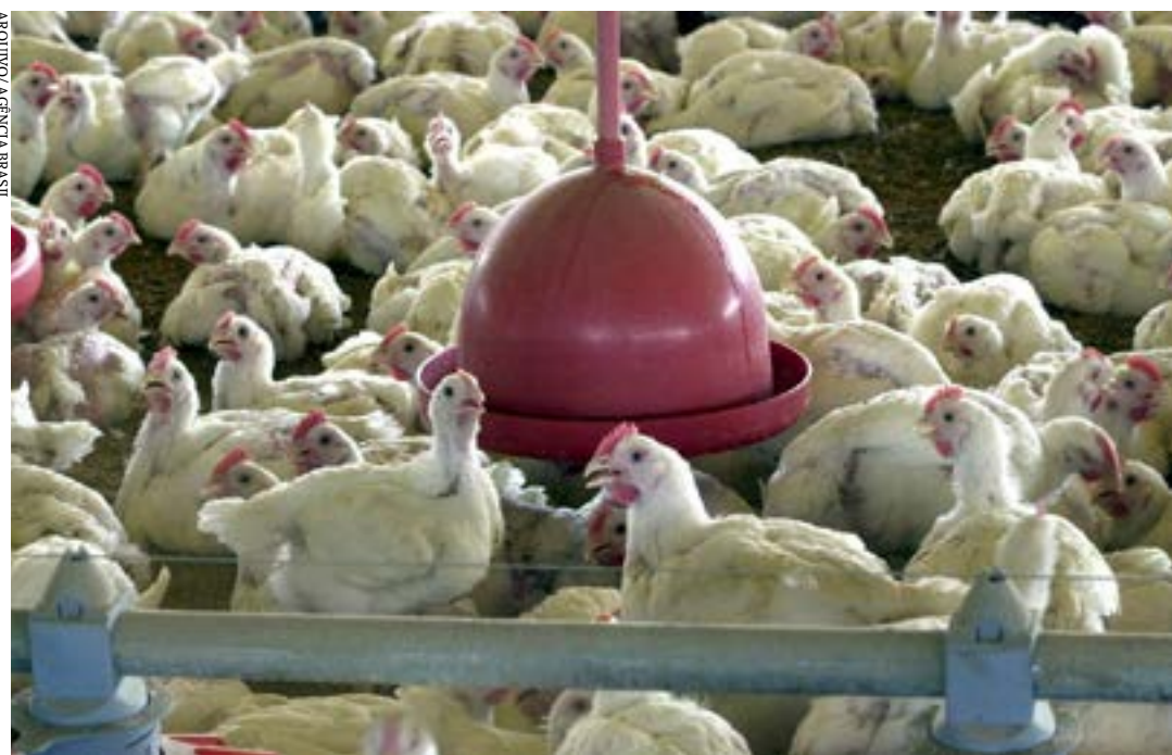
Levantamento do IBGE abrange também suínos e bovinos

O abate de frangos no segundo trimestre de 2022 caiu 2% e o de bovinos e de suínos cresceu 2,7% e 6,6%, respectivamente, na comparação com o mesmo período de 2021.