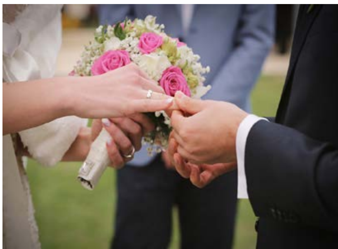
Alianças compradas não chegaram a tempo de cerimônia