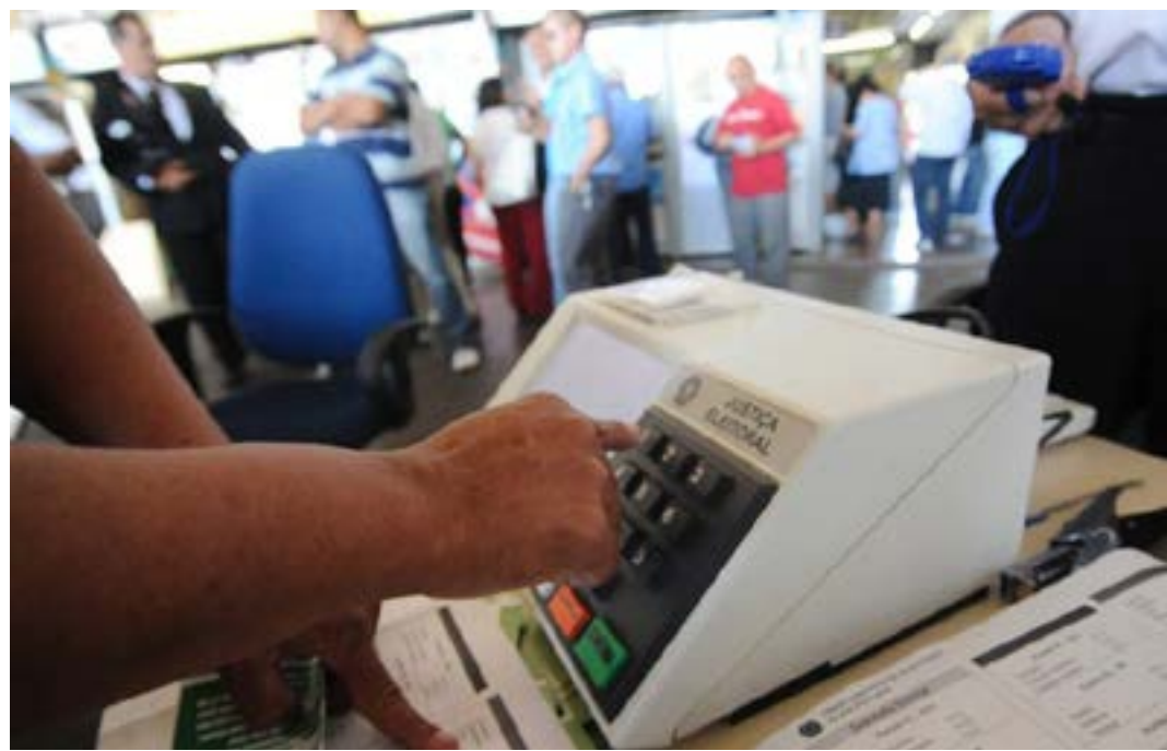
Entre as novidades estão a elevação da cláusula de desempenho e o incentivo a candidaturas de mulheres e pessoas negras

Atualmente há 30 partidos representados na Câmara dos Deputados. No Senado, há 17: Avante, Cidadania, MDB, PDT, PL, Podemos, PP,