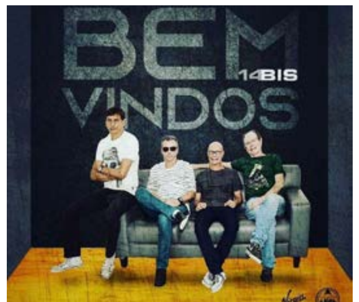
Dia 13 de Maio, a FOCCO PROMOÇÕES E O FAMOSO BONJUÁ HOTEL promovem o excelente e aguardadíssimo show da super banda 14 Bis. Promete!