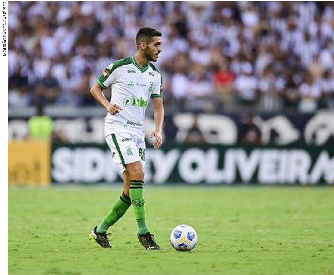
MOURÃO PANDA / AMÉRICA