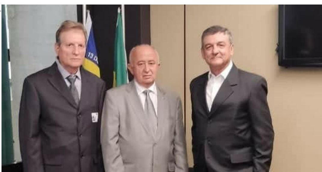
Representantes da Sociedade Rural de Montes Claros