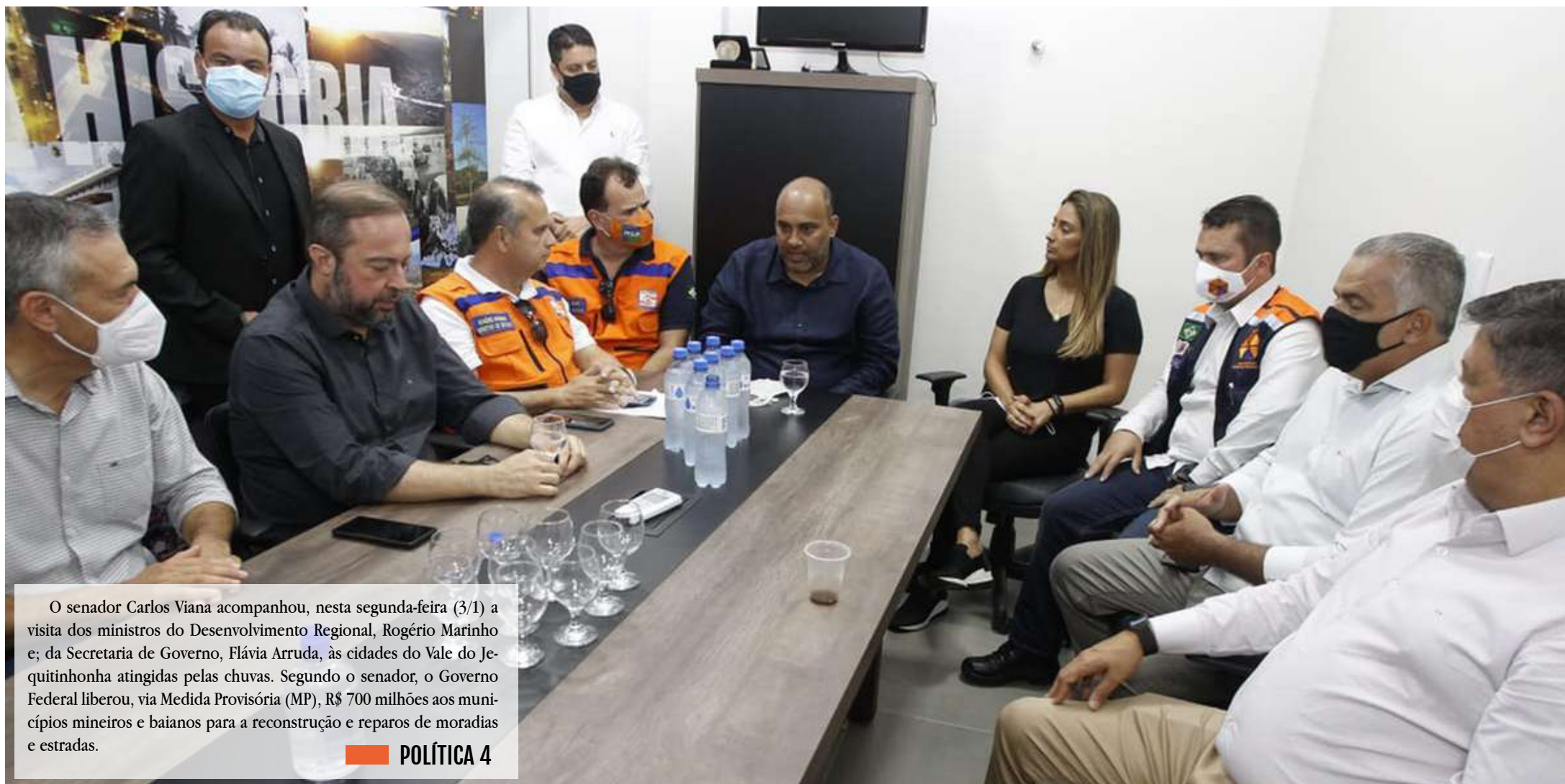
O senador Carlos Viana acompanhou, nesta segunda-feira (3/1) a visita dos ministros do Desenvolvimento Regional, Rogério Marinho e; da Secretaria de Governo, Flávia Arruda, às cidades do Vale do Jequitinhonha atingidas pelas chuvas. Segundo o senador, o Governo Federal liberou, via Medida Provisória (MP), R$ 700 milhões aos municípios mineiros e baianos para a reconstrução e reparos de moradias e estradas.