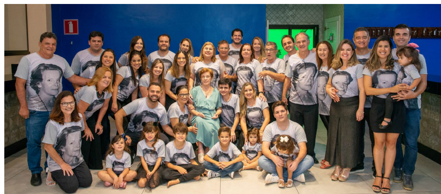
COM toda família na recepção no 'Duca Goumert'.