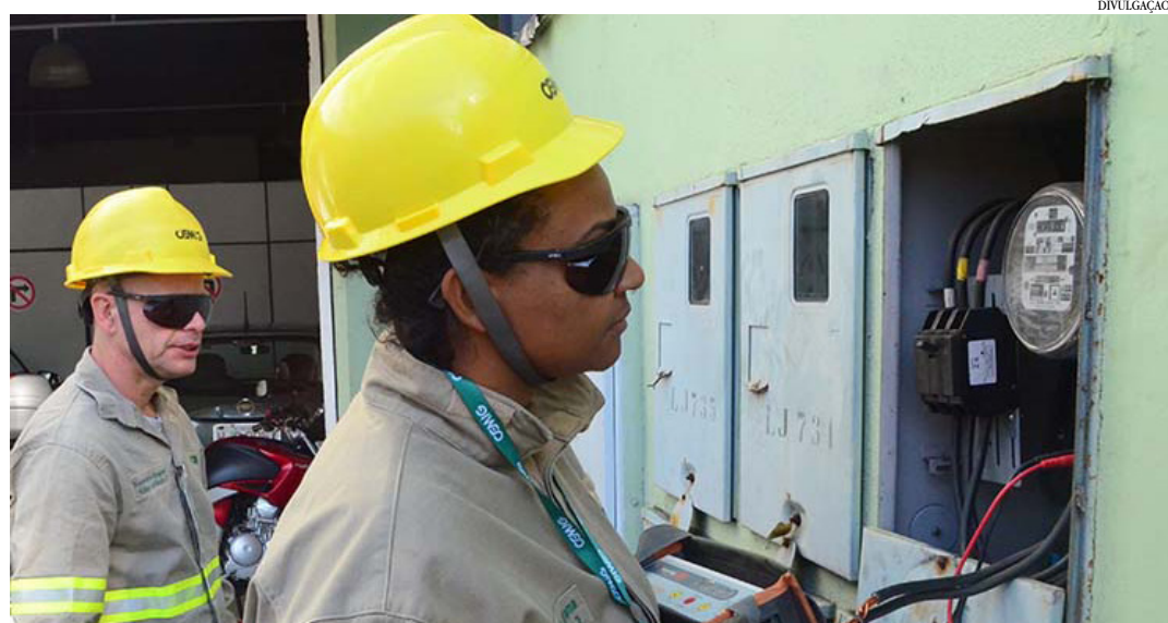
Companhia mineira não define aplicação, que é feita pela Aneel e válida para todos os consumidores do país

“Em setembro do ano passado, os reservatórios da região Sudeste atingiram o menor nível histórico e, mesmo com o grande volume de chuvas, o armazenamento do subsistema Sudeste/Centro-Oeste, registrado pelo Operador Nacional do Sistema Elétrico (ONS) no dia 11/1, foi de 33,56%;