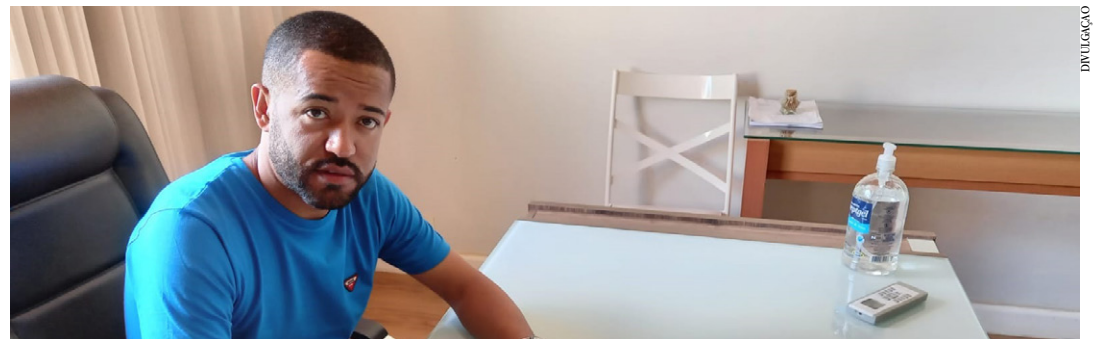
Prefeito assina documento da filiação ao consórcio

dos Machados passa a ingressar a nossa entidade num momento importante e de crescimento. Nosso objetivo é de continuar interagindo com os nossos consorciados, com informações precisas e necessárias que visam ampliar os serviços e garantir programas e projetos que beneficiem a gestão municipal e consequentemente a população", ressaltou. (ARTHUR JÚNIOR - Colaborador)