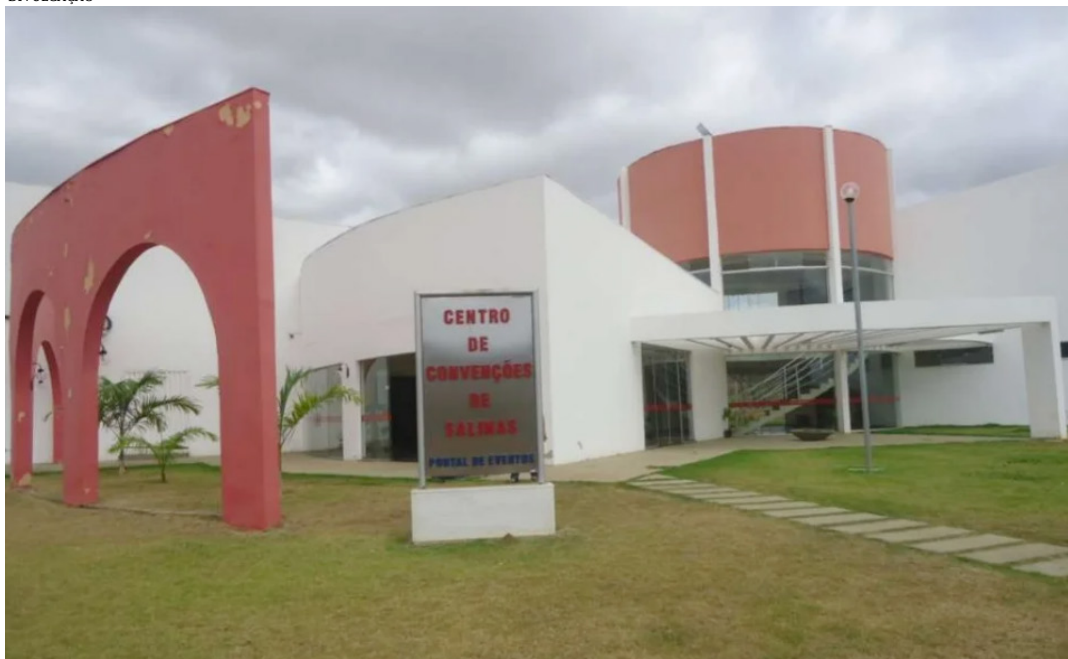
Pequenos negócios e produtores rurais vão conhecer e negociar melhores condições de crédito para a retomada das atividades

Cerca de 180 pequenos negócios de Salinas foram diretamente afetados pelas fortes chuvas do final de dezembro e início deste mês. Os empreendedores, principalmente dos setores de Comércio e Serviços, foram parcialmente ou totalmente destruídos com a enchente do rio Salinas, que também provocou muitos prejuízos aos pequenos produtores rurais do município.