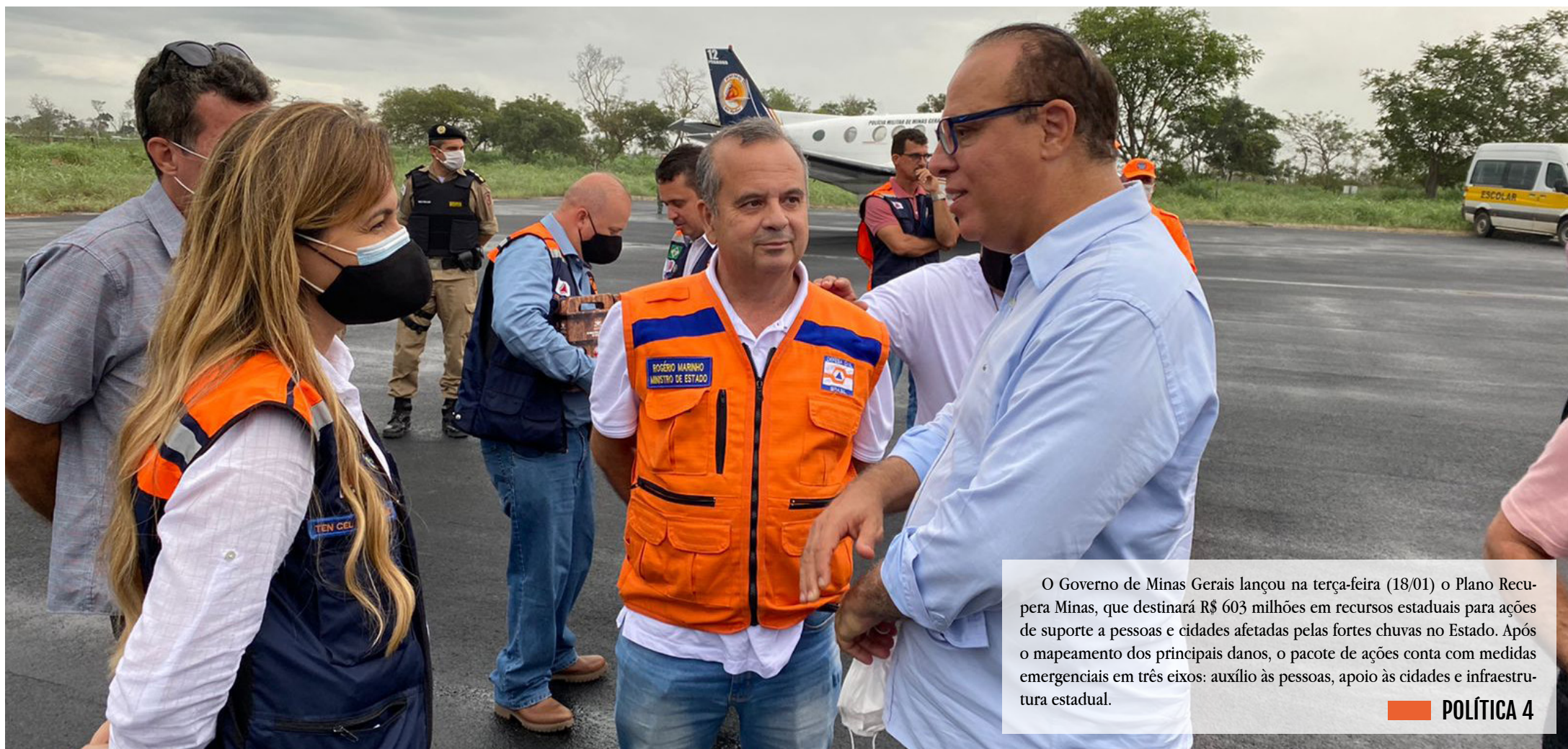
O Governo de Minas Gerais lançou na terça-feira (18/01) o Plano Recupera Minas, que destinará R$ 603 milhões em recursos estaduais para ações de suporte a pessoas e cidades afetadas pelas fortes chuvas no Estado. Após o mapeamento dos principais danos, o pacote de ações conta com medidas emergenciais em três eixos: auxílio às pessoas, apoio às cidades e infraestrutura estadual. POLÍTICA 4