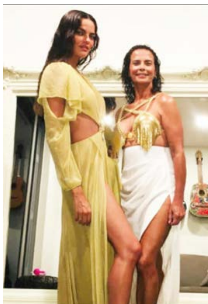
A FAMOSA modelo montes-clarense de fama internacional, Barbara Fialho numa pose especial com sua mãe Thelma.