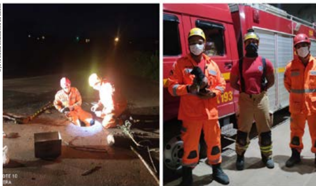
COP/AGÊNCIA/GOVERNADOR DO CARNEIRO