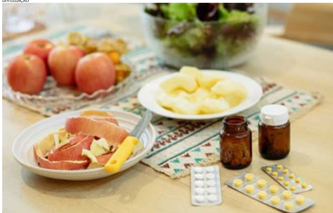
Medicamentos vendidos sem receita e consumo em excesso pode prejudicar a saúde