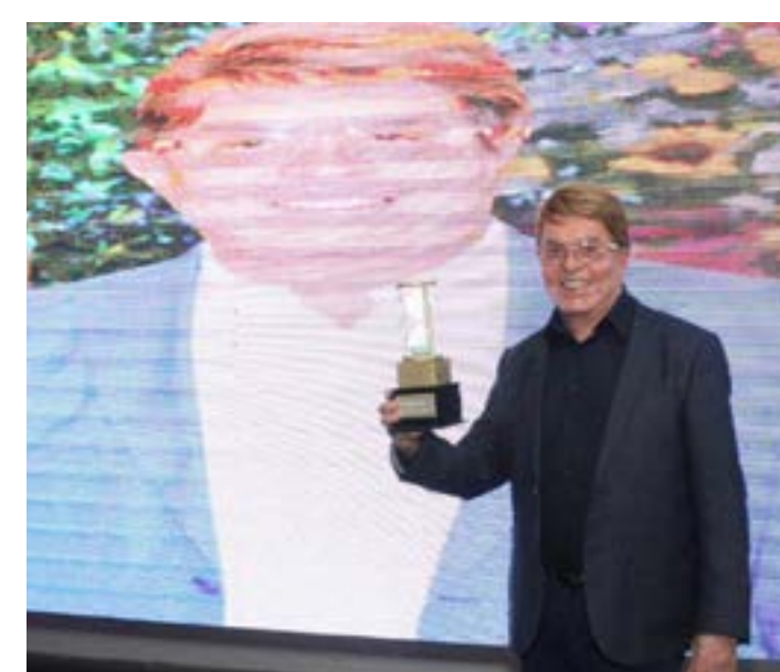
RECEBENDO o troféu "20 anos da revista 'Tempo'".