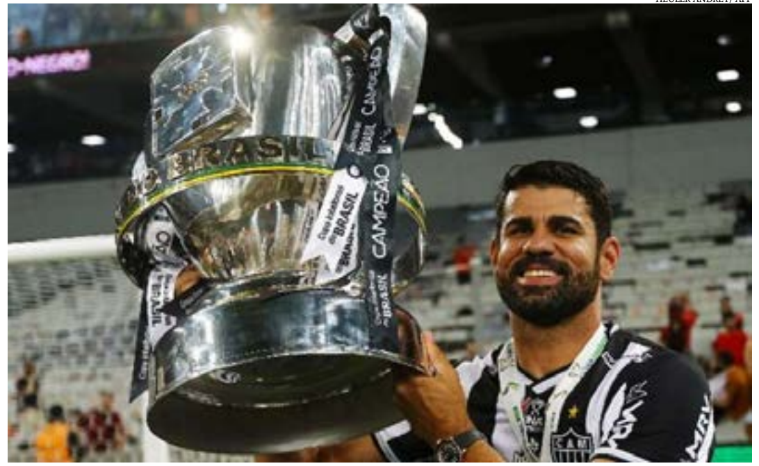
Diego Costa anuncia fim da trajetória no Atlético

Por isso, desfalcou a equipe em compromissos decisivos, como as partidas de volta da semifinal da Copa Libertadores contra o Palmeiras e da final da Copa do Brasil diante do Athletico-PR. Suspenso, o experiente centroavante também não jogou contra o Bahia, jogo que garantiu o título do Campeonato