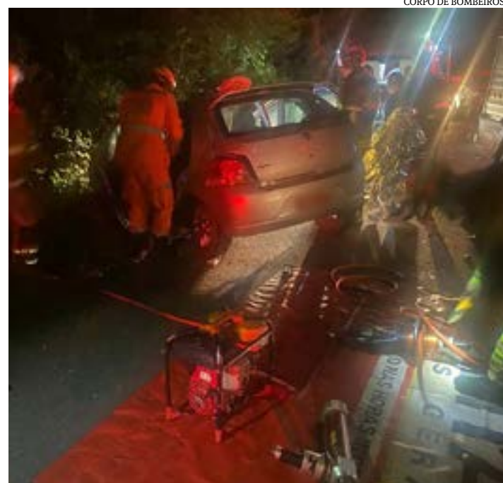
CORPO DE BOMBEIROS

Uma mulher e seu filho, de cinco meses, morreram numa colisão frontal entre dois carros de passeio na MGC-404, no Norte de MG, nesta sexta-feira (14). Outro