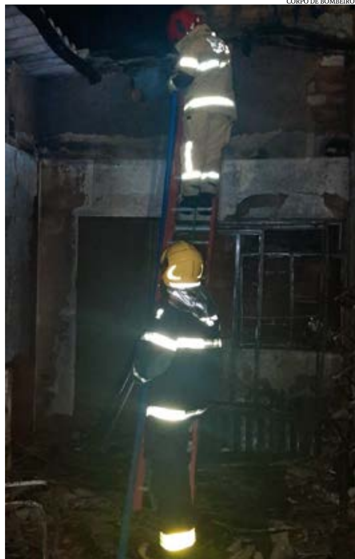
CORPO DE BOMBEIROS

A pessoa que seria responsável por iniciar o incêndio não foi encontrada. A PM acompanhou os trabalhos.