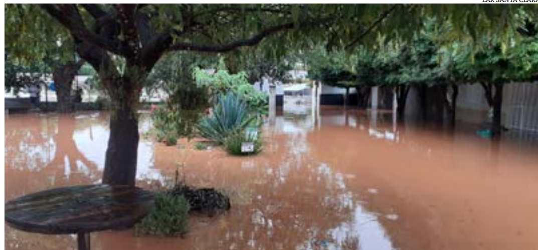
LAR SANTA CLARA

inaladores e computadores, precisam ser testados para ver se ainda funcionam. Salinas foi atingida por uma chuva forte e constante na noite do dia 27 e madrugada do dia 28 de dezembro. O rio, que tem o mesmo nome da cidade, transbordou e a água invadiu casas e comércios. Na segunda-feira (3),