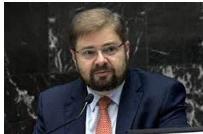
Deputado Estadual Agostinho Patrus