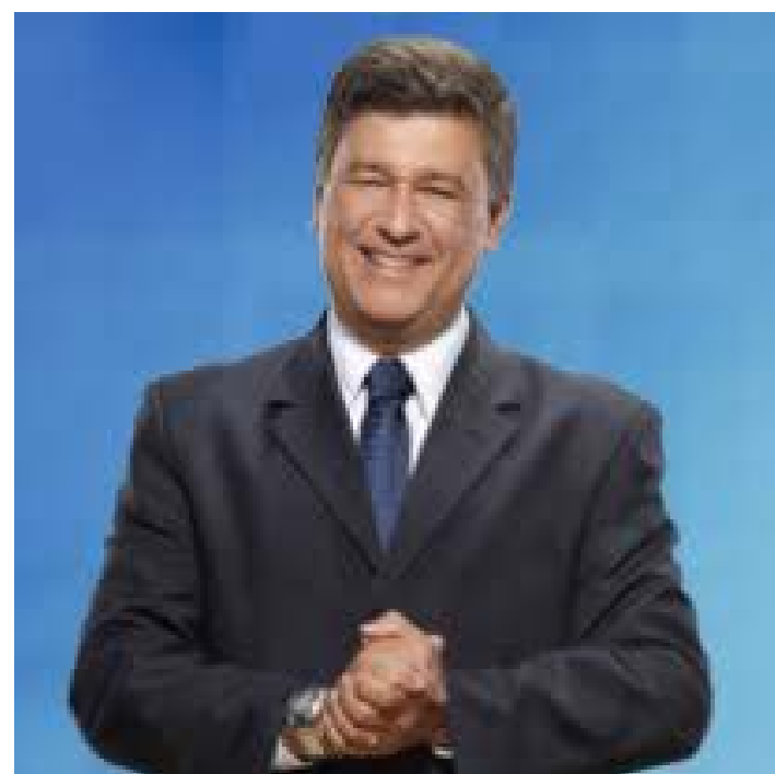
Carlos Viana- Senador