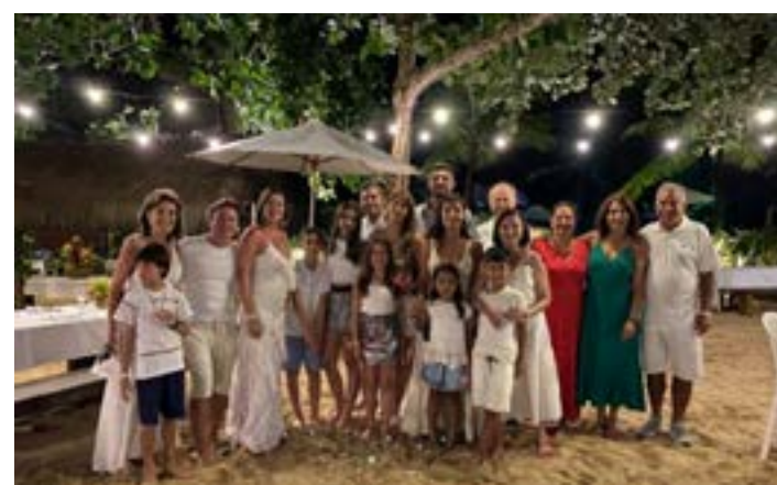
ESTA TURMA de Moc na virada no famoso Réveillon do 'Canto da Alvorada' aqui em Arraial.