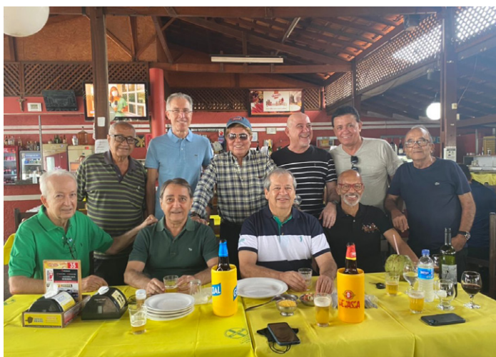
LOGO MAIS , depois de meio-dia, estarei reencontrando com os amigos da 'Diretoria' no Skema-Kente para colocar os assuntos em dia.