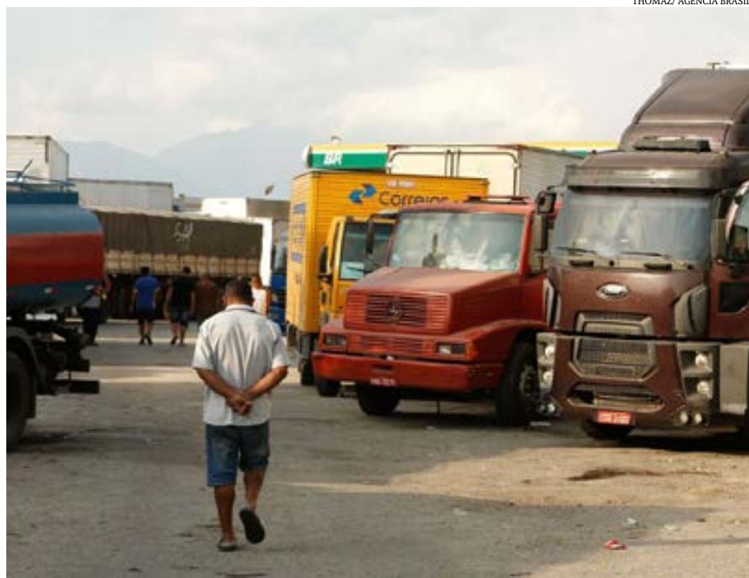
Com taxas a partir de 1,99% ao mês, linha começa em 24 de janeiro

Assim que a linha começar a operar, as empresas de transporte de cargas deverão pedir a habilitação do limite de crédito em qualquer agência da Caixa, mediante avaliação de crédito. Após a aprovação do limite, as empresas poderão contratar os empréstimos diretamente pelo Gerenciador Financeiro do banco. (Agência Brasil)