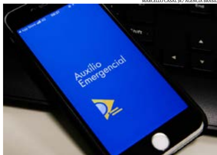
Acordos de cooperação entre órgãos contribuíram para o resultado

O ressarcimento dos recursos também pode ser feito por meio da emissão de Darf, no caso de recebimento indevido do Auxílio Emergencial pelos dependentes ou pelo titular da declaração de Imposto de Renda. Os valores recebidos são transferidos para a conta única do Tesouro Nacional e ficam à disposição da União. (Agência Brasil)