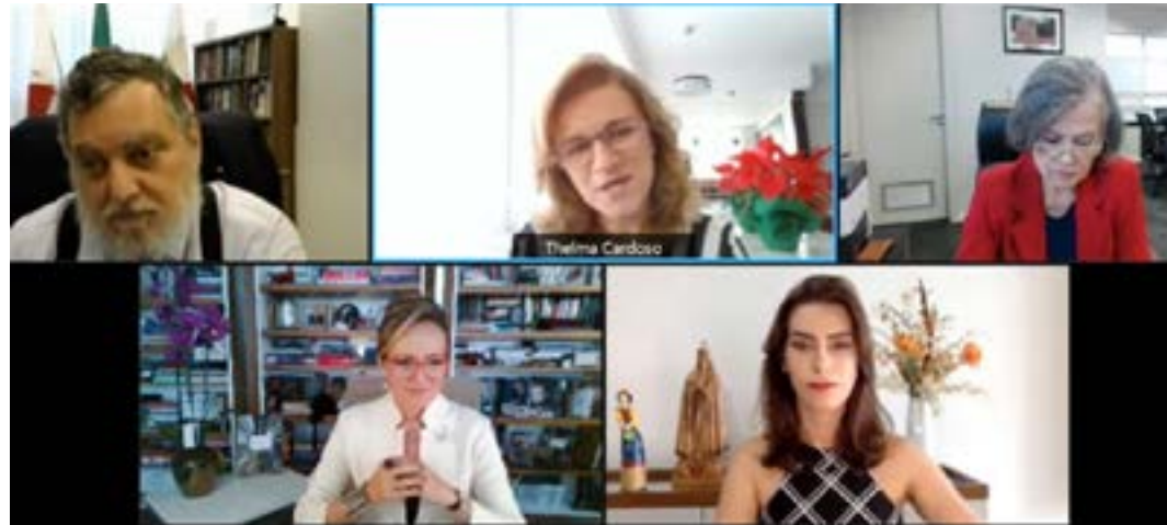
"Os estereótipos femininos ao longo da história: continuidades, rupturas e novos desafios" foi o tema da palestra

"O estereótipo ganha em exatidão e perde em profundidade porque simplifica e reduz nossa complexidade e obscurece nossas qualidades ao exaltar um mínimo de características", explicou a palestrante, que estudou a imagem da mulher no ocidente moderno. Analisando xilogravuras, pinturas, esculturas, fotografias e imagens em movimento, ao longo de oito anos, ela fez pesquisa de campo em nove países, passando dos arquivos de Bibliotecas da Alemanha, Suíça e Museus da Europa aos estúdios de Hollywood.