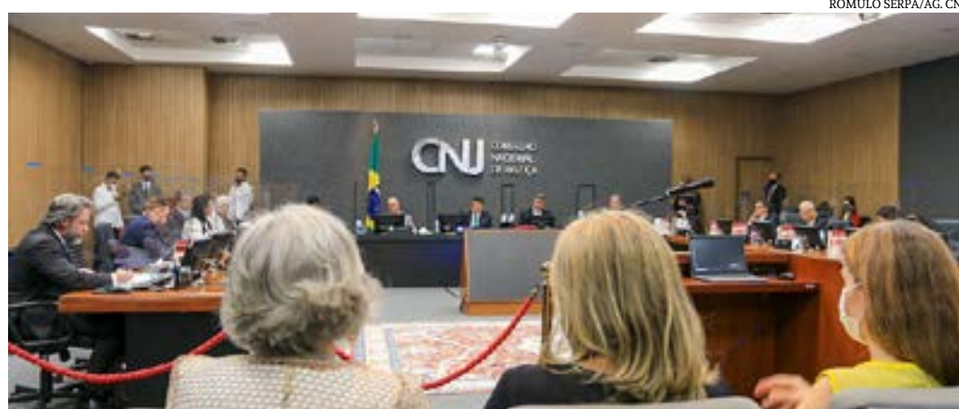
Premiação foi anunciada durante a 61ª sessão extraordinária do Conselho Nacional de Justiça (CNJ)