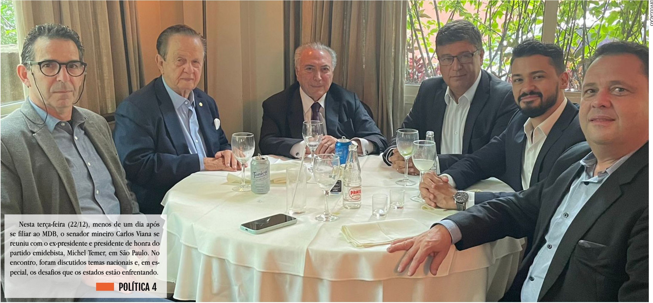
Nesta terça-feira (22/12), menos de um dia após se filiar ao MDB, o senador mineiro Carlos Viana se reuniu com o ex-presidente e presidente de honra do partido emedebista, Michel Temer, em São Paulo. No encontro, foram discutidos temas nacionais e, em especial, os desafios que os estados estão enfrentando.