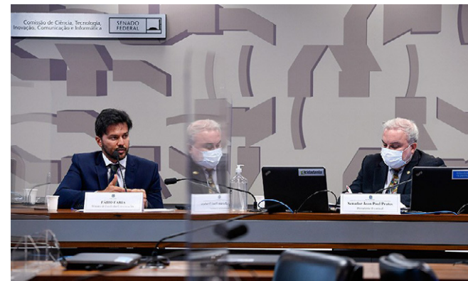
Fábio Faria e Jean Paul Prates, que deve apresentar relatório sobre a implantação das redes 5G como política pública fiscalizada neste ano pela comissão

LEILÃO DA TELEFONIA 5G VAI CORRIGIR 'FANTASMA DO FUST', AFIRMA MINISTRO DAS COMUNICAÇÕES