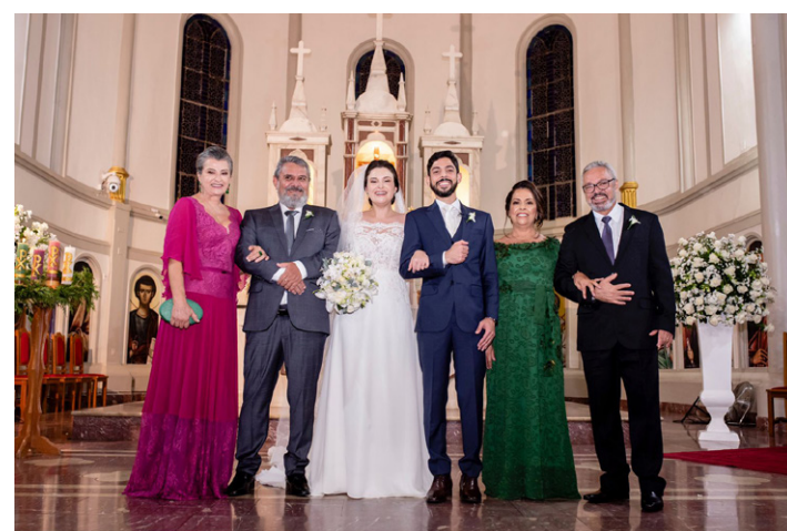
A FOTO OFICIAL DOS NOIVOS com seus papais no altar da Catedral.