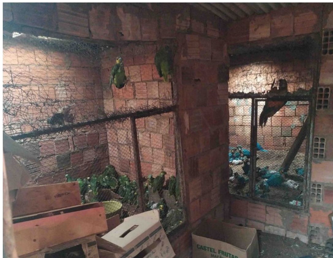
POLÍCIA MILITAR DE MEIO AMBIENTE