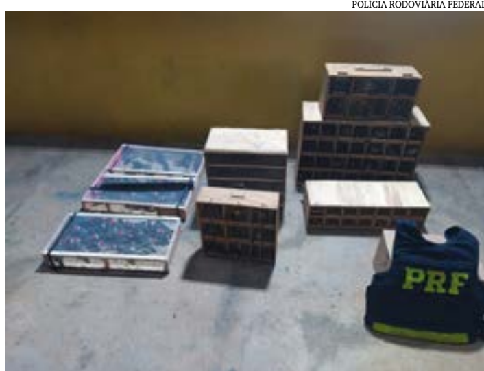
POLÍCIA RODOVIÁRIA FEDERAL

Ao todo, foram apreendidas 317 aves silvestres, sendo 63 da espécie coleirinha, 37 canários-da-terra, cinco sofrês, 14 azulão, 54 trinca-ferros vivos, 13 mortos e sete filhotes, 91 cardeais, nove bicos-de-pimenta, um pássaro preto, um sanhaço, um caboclinho e 21 papa-capins.