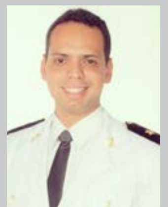
(*) Capitão PM – Comandante da 210ª Cia/10º Batalhão PM.

A vida sopra muito rápido! A brevidade da vida é por demais estranha e veloz! Viver uma vida pequena não vale a pena! Viver fechado, travado, com medo, insensível é estar morto antes da morte! Abracemos a quem precisamos abraçar! Elogiemos a quem precisamos elogiar! Olhemos nos olhos de quem carecemos olhar! Não esperemos pelo pior para compreender que poderíamos fazer mais e ser mais para os outros! Não nos deixemos levar pelas tristezas e amarguras! Cultivemos vida! Plantemos vida! Colhemos vida! Para amar não precisamos mais do que querer, do que se entregar, do que decidir amar! O amor é gratuito; fazer o bem é espontâneo, propagar vida em abundância é gracioso! Amemos enquanto ainda é tempo! E deixemos brotar nosso sorriso aos que nos vem antes que seja tarde, tarde demais!