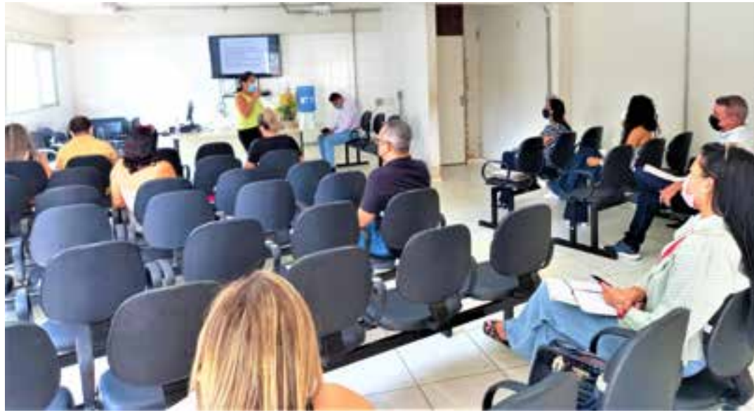
A reunião da Comissão Intergestores Bipartite - (CIB), realizada na sexta-feira, 5, contou com a participação de gestores de saúde do Norte de Minas