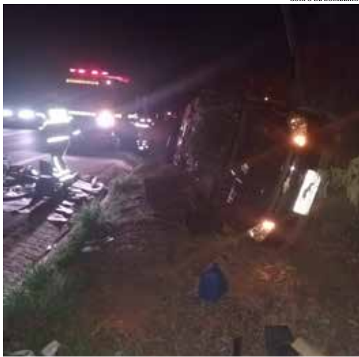
CORPO DE BOMBEIROS

Para a retirada da vítima, os militares utilizaram ferramentas hidráulicas para socorrer o motorista com segurança. Após os trabalhos, ele foi levado para o Hospital Municipal de Salinas.