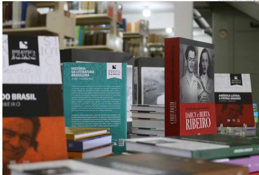
Títulos foram selecionados pelo próprio sociólogo montes-clarense, cujo centenário de nascimento será comemorado em 2022

O financiamento é da Lei de Incentivo Cultural do Ministério da Cultura. Em outubro de 2022, será comemorado o centenário de nascimento de Darcy Ribeiro, quem dá nome ao campus-sede da Universidade Estadual de Montes Claros. (Portal Unimontes)