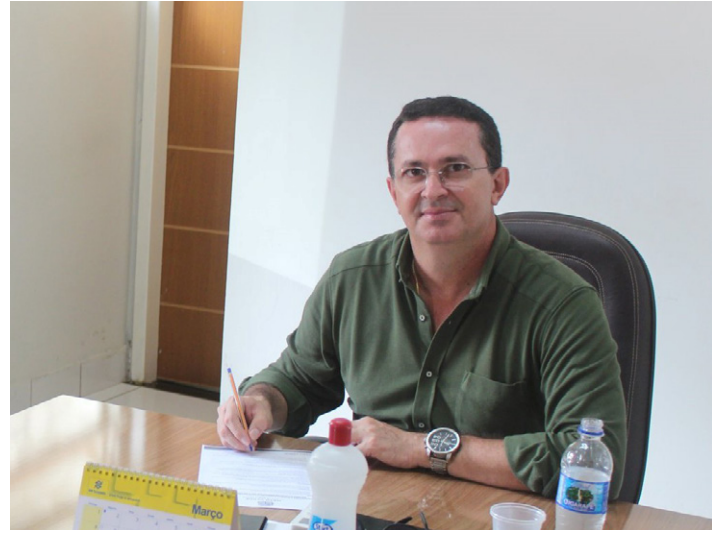
O prefeito Oscar Lisandro