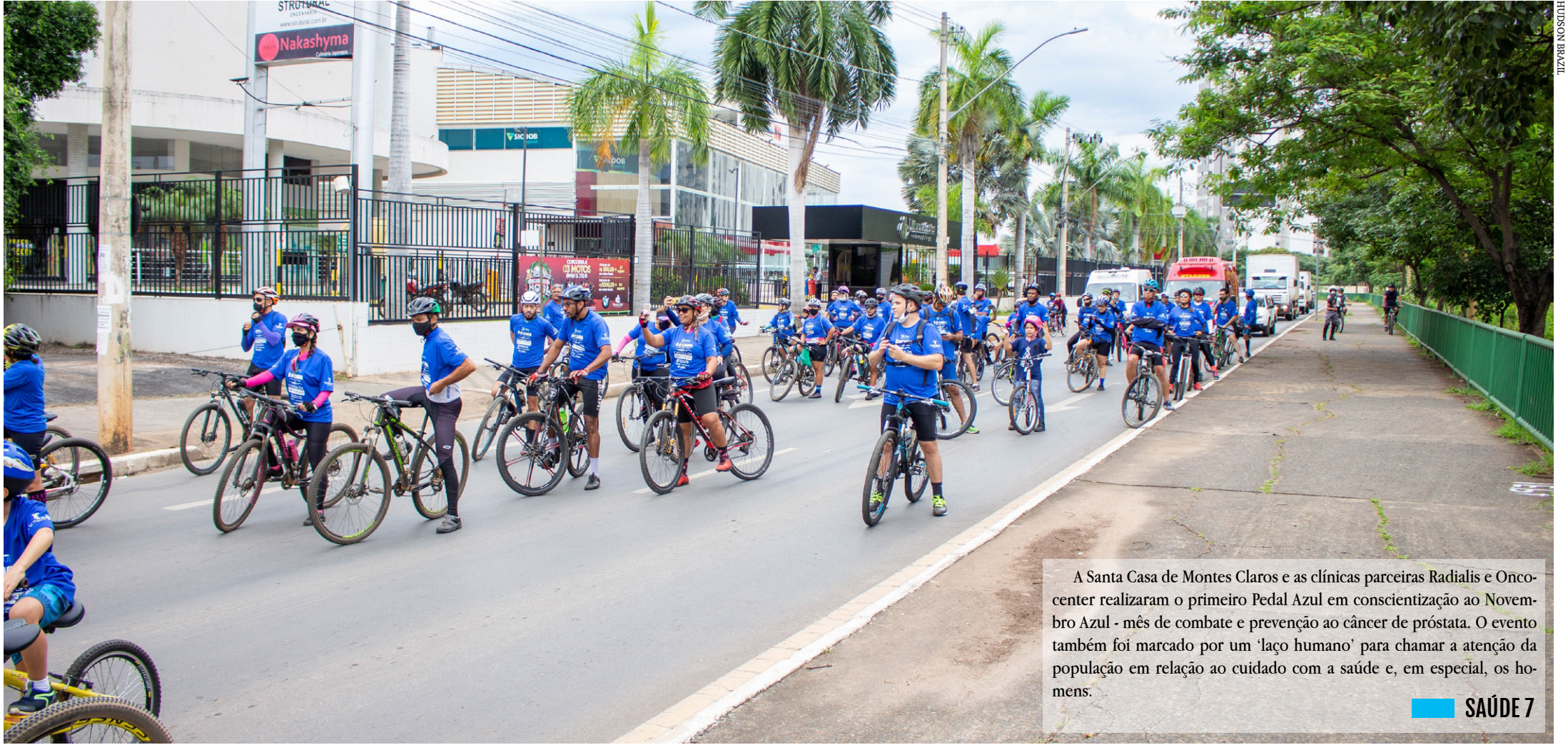
A Santa Casa de Montes Claros e as clínicas parceiras Radialis e Oncocenter realizaram o primeiro Pedal Azul em conscientização ao Novembro Azul - mês de combate e prevenção ao câncer de próstata. O evento também foi marcado por um 'laço humano' para chamar a atenção da população em relação ao cuidado com a saúde e, em especial, os homens.