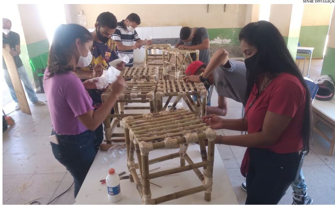
Técnicas para fabricação de móveis foram repassadas pelo instrutor

“Quando penso no pessoal do campo, de modo geral muitos têm