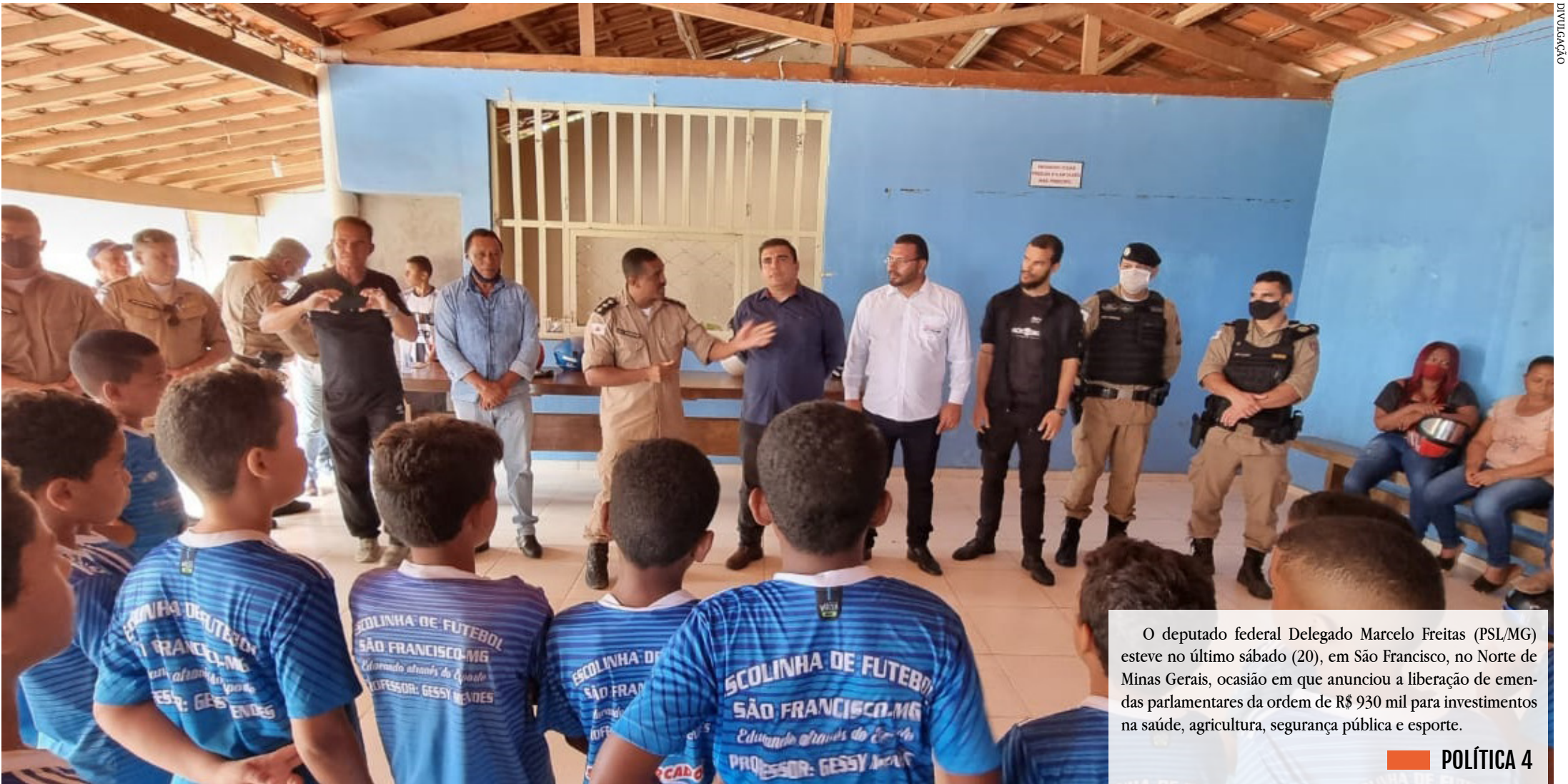
O deputado federal Delegado Marcelo Freitas (PSL/MG) esteve no último sábado (20), em São Francisco, no Norte de Minas Gerais, ocasião em que anunciou a liberação de emendas parlamentares da ordem de R$ 930 mil para investimentos na saúde, agricultura, segurança pública e esporte.