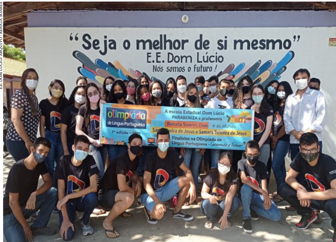
Competição nacional tem entre seus objetivos apoiar educadores da rede pública no aprimoramento das práticas de ensino de leitura

A lista com todos os finalistas para a última etapa da Olimpíada pode ser acessada no site https://www.escrevendofuturo.org.br/ . (Agência Minas)